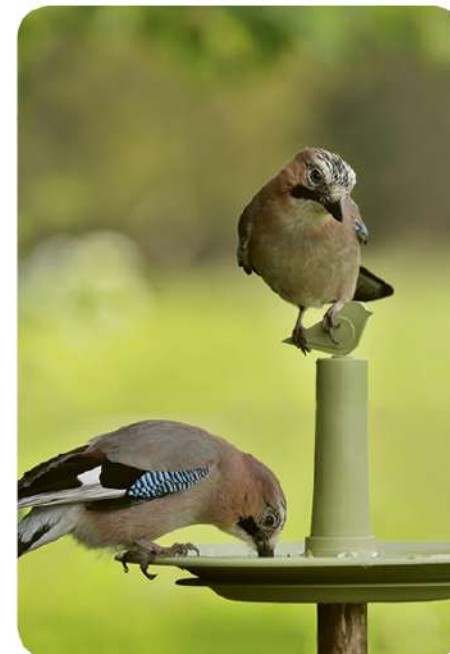
Svečiai paukščių girdykloje

paversti ją mėslinga, kupina atradimų, viliojančia ne tik mus, bet ir vabzdžius. Mažuose sklypuose reikia naudoti daugiau terasų, mažosios architektūros sprendinių, gerai parinkti augalus, ypač medžius ir krūmus, kad jie neišaugtų į labai didelius ir nekeltų nepatogumų. Todėl tokiems sklypams reikia rinktis skiepytus, mažesnio augumo medžius, kurie dar ir lengvai karpomi, formuojami. Kad ir kokia maža atrodytų jūsų erdvė, būtina įkomponuoti bent vieną medį, o dar geriau – tris. Kam to reikia? Medžiai sukuria privatumą, malonią paunksnę, lauko erdvės „lubas“, leidžia mėgautis gaiviesniu oru vasarą, o juos apšviesti norėsite vakarais ilgiau užsibūti sode.