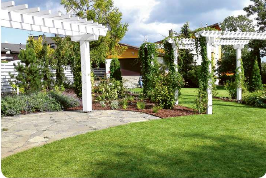
Apželdintos pergolės kiemams suteikia jaukumo

Spygliuočiai ar lapuočiai? Želdinant sklypus rekomenduotina spygliuočių augalų naudoti iki 20 procentų, daugiau sodinti lapuočių. Lapuočiai kraštovaizdžiui suteikia daugiau dinamikos, judesio. Jų kaita mus labiau vilioja į kiemą. Pavasarį sprogsa lapai, sklaidžiasi žiedai, vasarą turime gairių pavėsį, rudenį lapai keičia spalvą, krenta, kol galiausiai medžiai parodo šakas. O žiemą lapuočiai medžiai ir krūmai, papuošti kalėdinėmis lemputėmis, atrodo gerokai gražiau už spygliuočius. Tokios medžių, krūmų ir daugiamečių augalų kompozicijos primena laukinę gamtą, turi daug paslapties, leidžia patirti atradimo džiaugsmą ir privilioja daugiau paukščių, vabzdžių į mūsų kiemą.