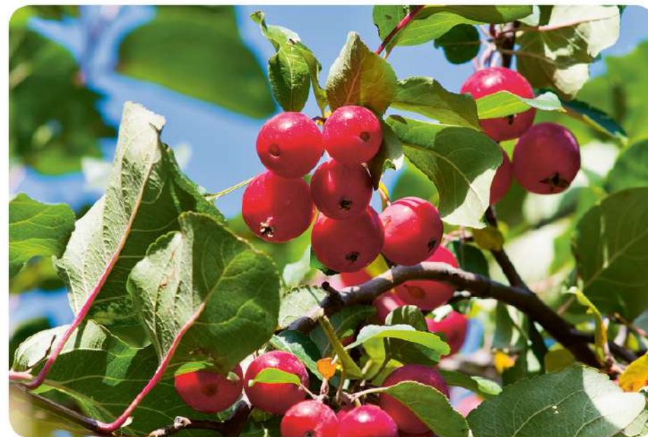
Želdynuose populiarėja rojaus obelys

Gyvatvorių įvairovė. Pastebiu, kad Lietuvoje gyvatvorėms naudojamos ne tik tujos, galima matyti ir labai gražių gyvatvorių iš bukų ar skroblų. Tik šiek tiek bijoma sodinti gyvatvorių kiemo viduje. Iš tiesų verta apsvarstyti šią idėją zonuojant teritoriją. Juk gyvatvorė gali būti griežtos ar laisvos formos ir duoti naudos. Pavyzdžiui, daržo zoną galima apsodinti uogakrūmiais ir suteikti daržui