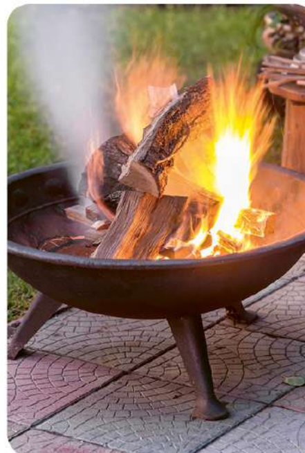
Prie laužavietės malonu vakaroti