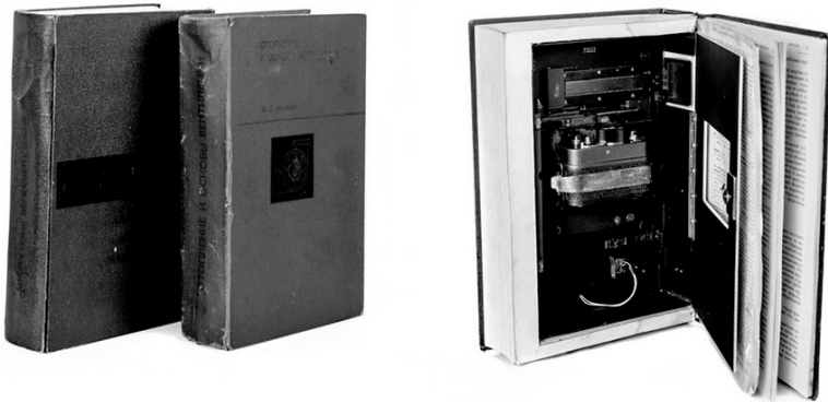
Sovietų KGB laboratorijose sukurtos knygos su įtaisyta kamera ir garsą įrašancia įranga.

Mokslas deramą dėmesį skiria ir televizijai kaip šnipinėjimo įrankiui. Žvalgybos srityje dirbantys mokslininkai sukūrė moteriško rankinuko dydžio TV kameras su įtaisytais tranzistoriais, maitinamais klausos aparatų baterijomis. Dėl mažo dydžio jas lengva paslėpti, pavyzdžiui, lentynoje už knygų, pritvirtinant po stalu arba stalčiuje, po apatiniais drabužiais. Šiose TV kamerose įmontuoti vaizdą fiksuojantys išmanieji lęšiai, kuriuos sudaro plonas lankstus strypelis. Jį galima pakisti po durimis į užrakintą kambarį, prakišti pro rakto skylutę ir net pro siaurą sienoje iškaltą skylę. Šis lankstus strypelis, sulenktas stačiu kampu, laužia šviesą ir perduoda vaizdą. Šio tipo kameros nėra plačiai naudojamos, bet kartais jos gali agentui neįtikėtina padėti.