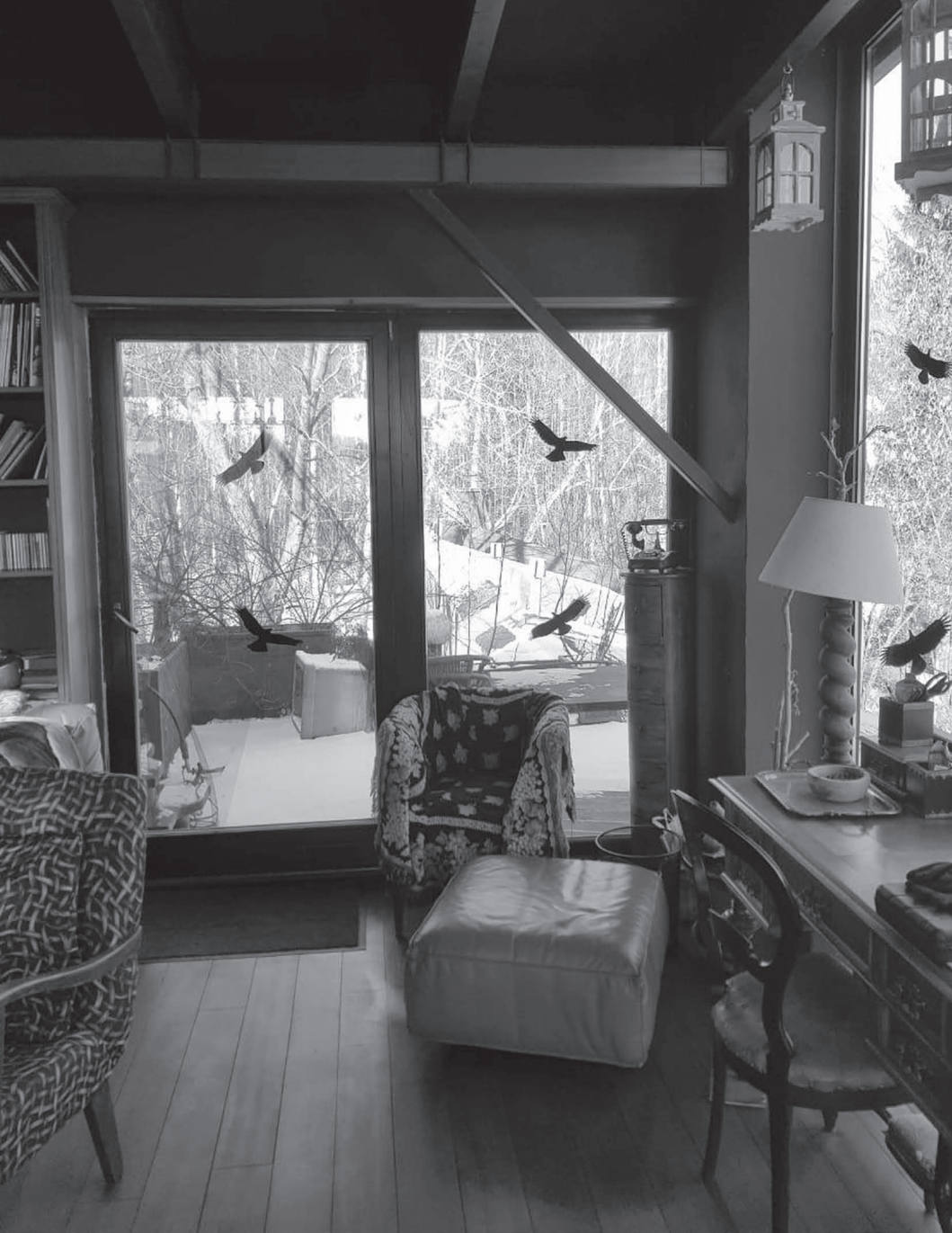
Namas Liaskose. Kambarys, kuriame vyksta spektaklių repeticijos