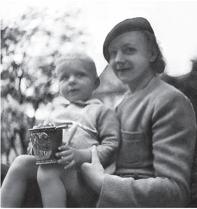
Su mama, 1941 m.