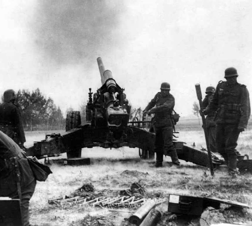
Vermachto artileristai apšaudė lenkų kariuomenės pozicijas iš 150 mm kalibro sunkiosios haubicos.

Sunaikinta lenkų kariuomenės gurguolė prie Bzuros upės.