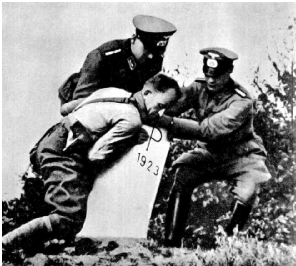
Įsiveržimo į Lenkiją pradžia. Vokiečių karininkai verčia 1923 m. pastatytą Lenkijos valstybės sienos stulpą.

Radomą artėjo prie Varšuvos ir rugsėjo 8 d. pasiekė Gura Kalvariją (lenk. Góra Kalwaria ) – miestelį Varšuvos pietvakariuose. Taip klostantis įvykiams, didelė stipri lenkų kariuomenės dalis prie Radomo buvo apsupta ir priversta sudėti ginklus. Generolo J. Blaskovico vadovaujama 8-oji armija sėkmingai stūmė lenkus nuo abiejų Lodzės pusių Bzuros upės link.