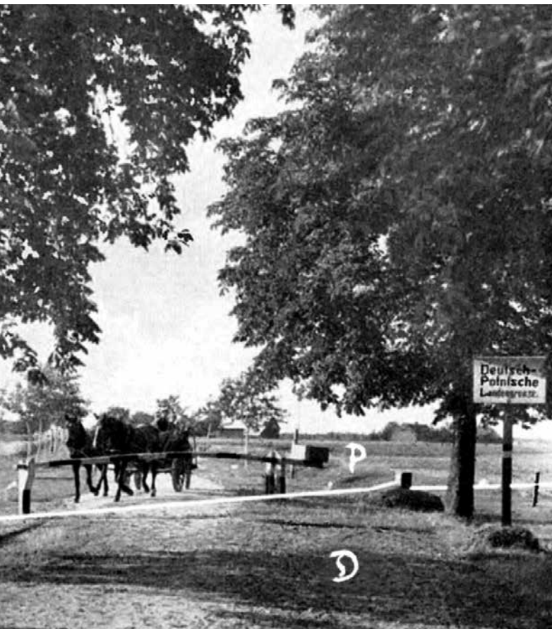
Prieškario Lenkijos ir Vokietijos siena. Šioje nuotraukoje raide D pažymėta Vokietijos, o raide P - Lenkijos teritorija.