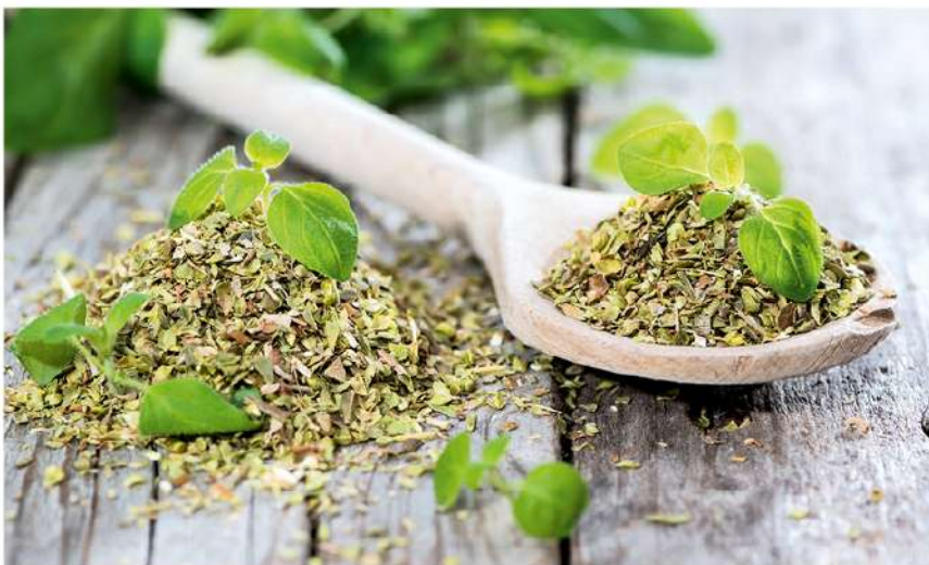
Vartojamas kaip prieskonis, tačiau turi ir daug vaistinių savybių

Kilmė ir paplitimas. Kvapusi mairūnas kilęs nuo Viduržemio jūros pakrančių, kur auga kaip daugiametis arba dvimetis augalas. Auginamas šilto ir vidutinio klimato juostose: visoje Europoje, Šiaurės Afrikoje, Prancūzijoje, JAV, Vokietijoje. Lietuvoje apyretis, auginamas soduose, daržuose, vienmetis.