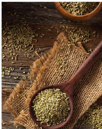
Sėklos dažniausiai vartojamos kaip vaistinė žaliava

Kilmė ir paplitimas. Augalas kilęs iš Viduržemio jūros pakrančių ir Mažosios Azijos. Savaimė auga Kryme, Kaukaze, Vidurinėje Azijoje. Auginamas Pietų ir Šiaurės Amerikoje, Pietų ir Vidurio Europoje. Populiariesnis Prancūzijoje, Vokietijoje, Bulgarijoje, Vengrijoje. Lietuvoje retas, auginamas daržuose.