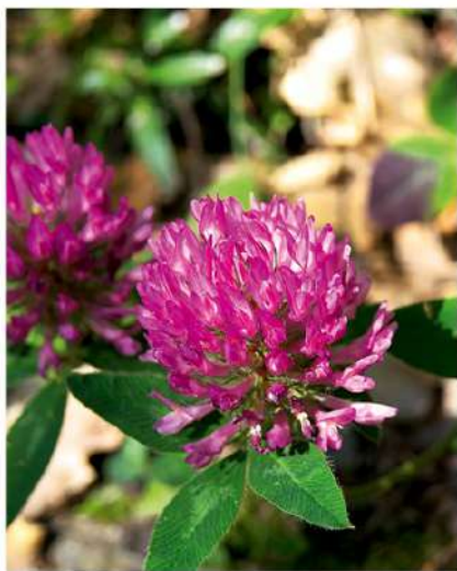
Žiedai smulkūs, bekočiai