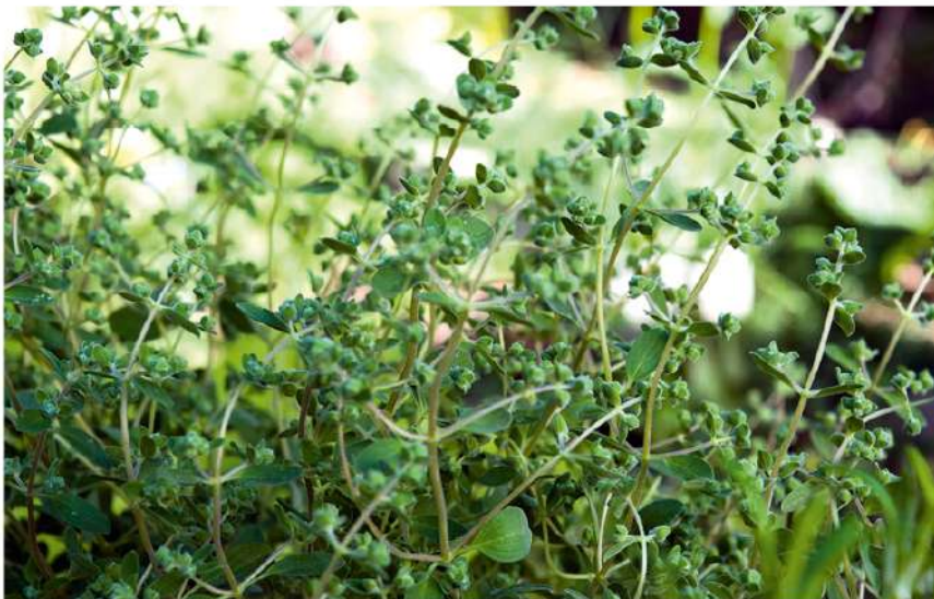
Lietuvoje auginamas soduose, daržuose