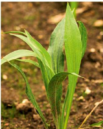
Geltekklė – daugiamečių augalas

Šeima: astrinių ( Asteraceae Bercht. & J. Presl)