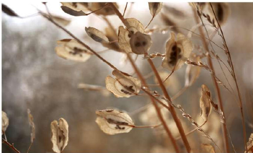
Sunokusios čiužutės sėklos

Kilmė ir paplitimas. Augalas paplitęs visoje Europoje, Kaukaze, Vidurinėje Azijoje, Vakarų ir Rytų Sibire, Toluosiuose Rytuose, Šiaurės Amerikoje. Lietuvoje dažnas augalas, paplitęs kaip piktžolė, pastebimas daržuose, pakelėse, šiukšlynuose, dykvietėse, ant pylimų.