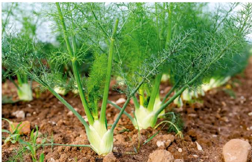
Augalas mėgsta šilumą ir saulę