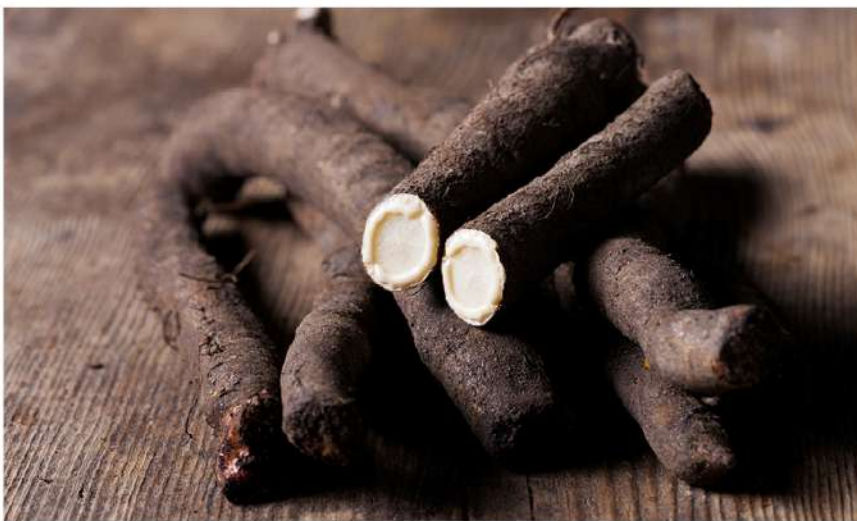
Šaknys kasamos vėlai rudenį arba anksti pavasarį

Kilmė ir paplitimas. Valgomoji geltekklė savaime auga ir yra paplitusi Pietų Europoje, Pietų Sibire. Lietuvoje savaime neauga. Auginama daržuose, soduose, pataliko sulaukėjusių.