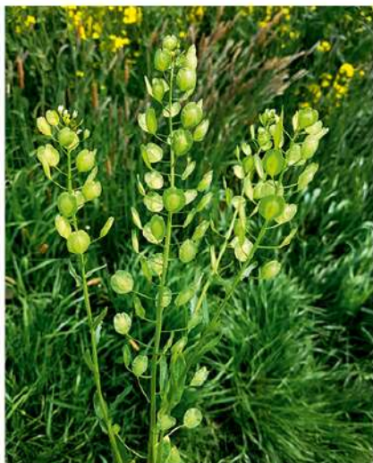
Čiužutė – dažnas augalas Lietuvoje

Šeima: bastutinių ( Brassicaceae Burnett)