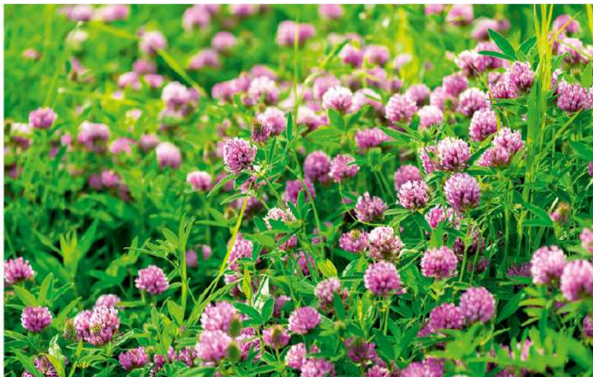
Lietuvoje dobilai dažni