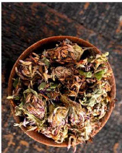
Žiedynai ir žolė ruošiami visą vasarą

Kilmė ir paplitimas. Raudonasis dobilas auga ir yra paplitęs Europoje, Vakarų ir Rytų Sibire, Kaukaze, Vidurinėje Azijoje. Šiaurės ir Pietų Amerikoje, Naujojoje Zelandijoje. Tolimuosiuose Rytuose – atneštinis. Lietuvoje dobilai labai dažni, auga pievose, kirtimuose, miško aikštelėse, ganyklose, šlaituose.