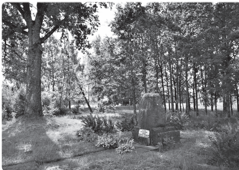
Ilgalaukių kaime J. Tūbelio gimtuosius namus žymi paminklinis akmuo bei kieme augantis ąžuolas. Sodyboje 1989 m. buvo pasodinta ąžuoliukų giraitė. 2019 m.