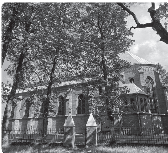
Panemunėlio bažnyčios priekinis ir šoninis fasadas. 2019 m.