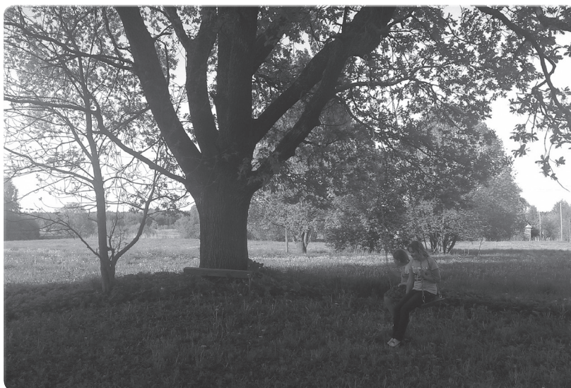
J. Tūbelio tėvui priklausiusio Augustinavos dvaro vietą šiandien žymi senas ąžuolas.