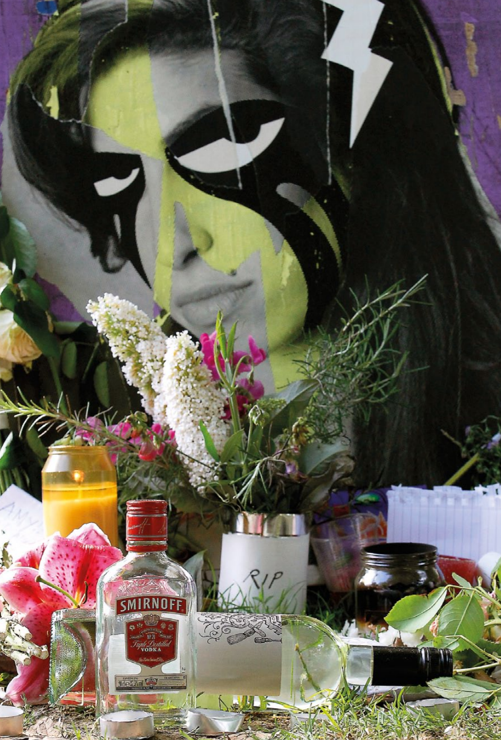
256-257 2011 metų liepos 23 dieną, kai mirė Amy Winehouse, šimtai gerbėjų rinkosi priešais jos namus Kamdeno aikštėje išreikšti pagarbą. Ji mirė perdozavusi alkoholio ir narkotikų. Laidotuvės įvyko 2011 metų liepos 26 dieną Eidžverberio Leino kapinėse Londone.