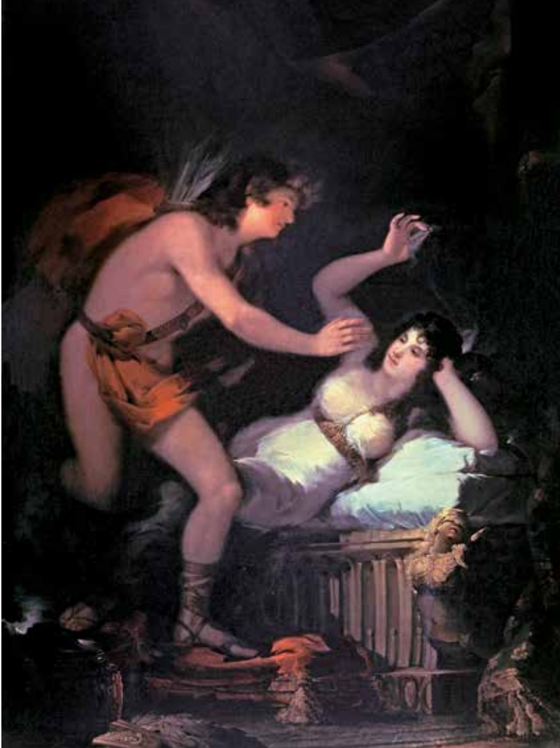
Kupidonas ir Psichė, apie 1798–1805 m., Katalonijos nacionalinis dailės muziejus, Barselona, Ispanija, 220,5 cm x 155,5 cm

Goja nutapė vos kelis mitologinius kūrinius. Liucijus Apulėjus (Lucius Appuleius; apie 125–180) II a. po Kr. lotynų kalba parašytame romane Metamorfozės pasakoja, kaip meilės dievas Kupidonas įsimyli mirtingąją Psichę. Norėdamas nusiūpti savo tapatybę, Kupidonas pas ją lankosi naktimis. Gojos kompozicija primena Ticiano paveikslą Tarkvinijus ir Lukrecija , kurį dailininkas matė karališkojoje Ispanijos kolekciijoje.