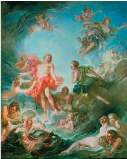
Saulės pakilimas, Bušė, 1753 m. Nors Gojai niekada nepatiko saldus, žaismingas rokoko stilius, jis savo stilių išvystė tyrinėdamas štai tokius paveikslus.

1703–1770) ir Žanas Onorė Fragonaras (Jean Honoré Fragonard; 1732–1806).