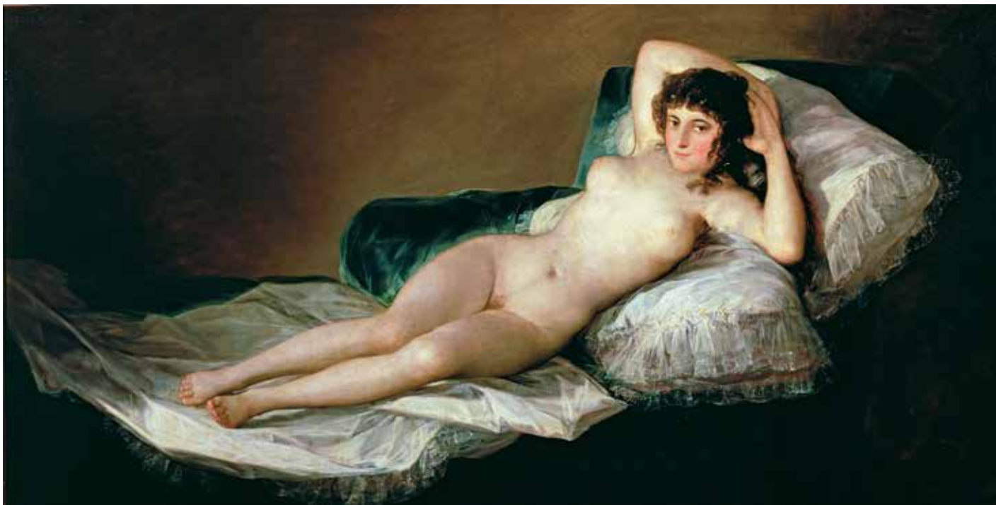
Nuoga macha, 1797–1800 m., aliejus ant drobės, Nacionalinis Prado muziejus, Madridas, Ispanija, 98 cm x 191 cm

Moters aktas – retenybė ispanų mene, tačiau Goja šios temos ėmėsi provokuojamai ir nenuolaidžiai. Tai pirmas paveikslas, kuriame vaizduojami gaktos plaukai –