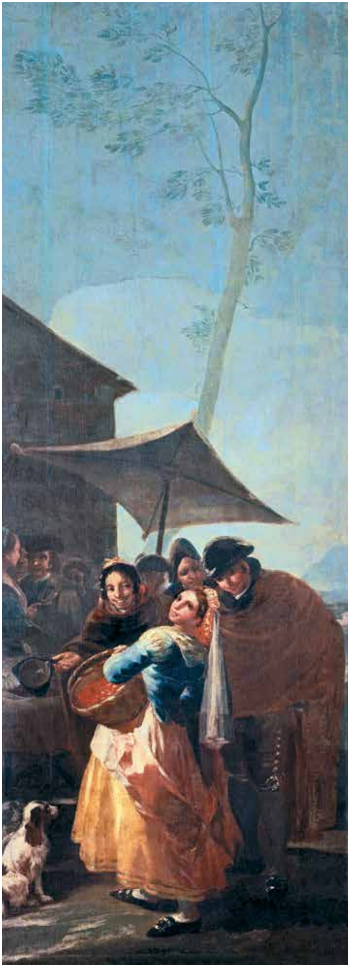
Vyšnių pardavėja, 1779 m., aliejus ant drobės, Nacionalinis Prado muziejus, Madridas, Ispanija, 259 cm x 100 cm

Moteris, apsirengusi kaip macha, nusiuka nuo būrelio žmonių su apsiaustais ir flirtuodama žvelgia į žiūrovą. Čia vaizduojama kasdienė turgaus scena Madride, nors vyrai labiau susidomėję jauna moterimi, o ne jos uogų krepšeliu. Nors kūrybą riboja rūmų menų formos, kur turėjo kabėti gobelenai, Gojos sprendimai labai kūrybingi.