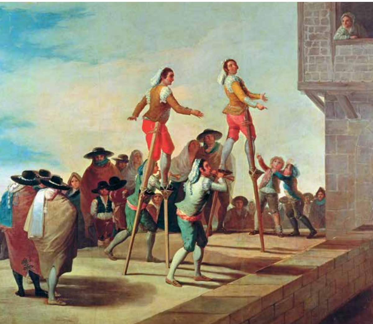
Kojūkai, 1791–1792 m., Nacionalinis Prado muziejus, Madridas, Ispanija, 268 cm x 320 cm

Du jaunuoliai ant kojūkų artinasi prie lango, pro kurį pasilenkusi jauna moteris. Juos pėsčiomis lydi dar du jaunuoliai, grojantys dulzainomis (į obojų panašiais instrumentais). Reginį stebi būrelis žiūrovų. Kaip ir visi kiti Gojos gobelenų projektai Karolio IV kabinetui Eskorialyje, šis irgi turi slaptą prasmę. Įspėjama, kad Ispanija turi atsargiai žvelgti į Europoje vykstančius neramumus.