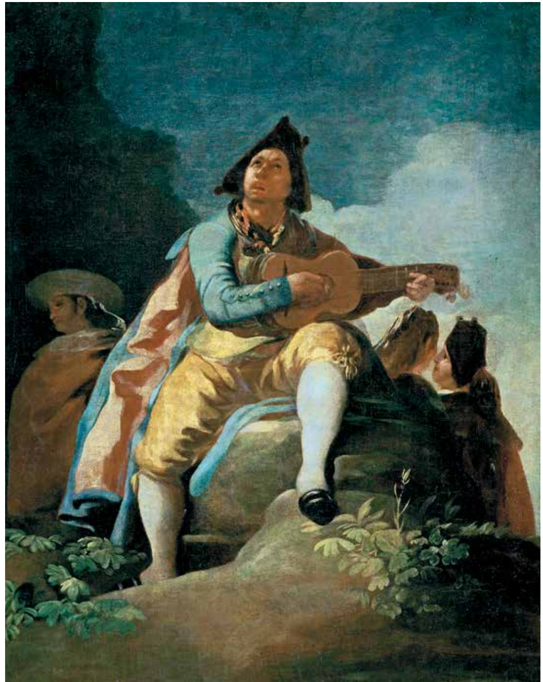
Machas su gitara, 1779 m., aliejus ant drobės, Nacionalinis Prado muziejus, Madridas, Ispanija, 137 cm x 12 cm

Tai diptiko dalis – vienas iš dviejų paveikslų, suporuotas su Skalbėjomis (žr. p. 123). Čia machas groja gitara – šis gobelenas turėjo kabėti virš pagrindinio miegamojo durų Pardo rūmuose. Kai