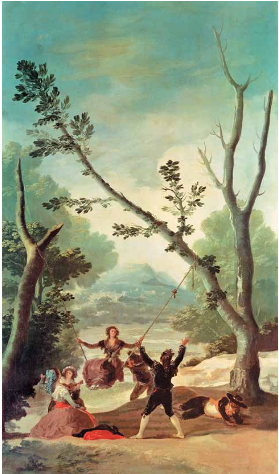
Sūpuoklės, 1786–1787 m. Čia matyti, kad Goja sugebėjo perimti rokoko ir neoklasicizmo stilius, neprisirišdamas nė prie vieno.

Štai taip vystėsi neoklasicizmas: iš dalies priešinantis rokoko lengvabūdiškumui, iš dalies atsispiriant nuo atgijusio susidomėjimo antikos menu. Po baroko ir rokoko stilių neoklasicizmas su aiškiais linijomis, vingiuotais, bet tvirtais kontūrais, aiškia perspektyva, grynomis ar jausmingomis spalvomis, darniomis proporcijomis ir dažnai rimtomis ar dramatiškomis temomis atrodė ir radikalus, ir įdomus. Tarp garsių neoklasicizmo dailininkų