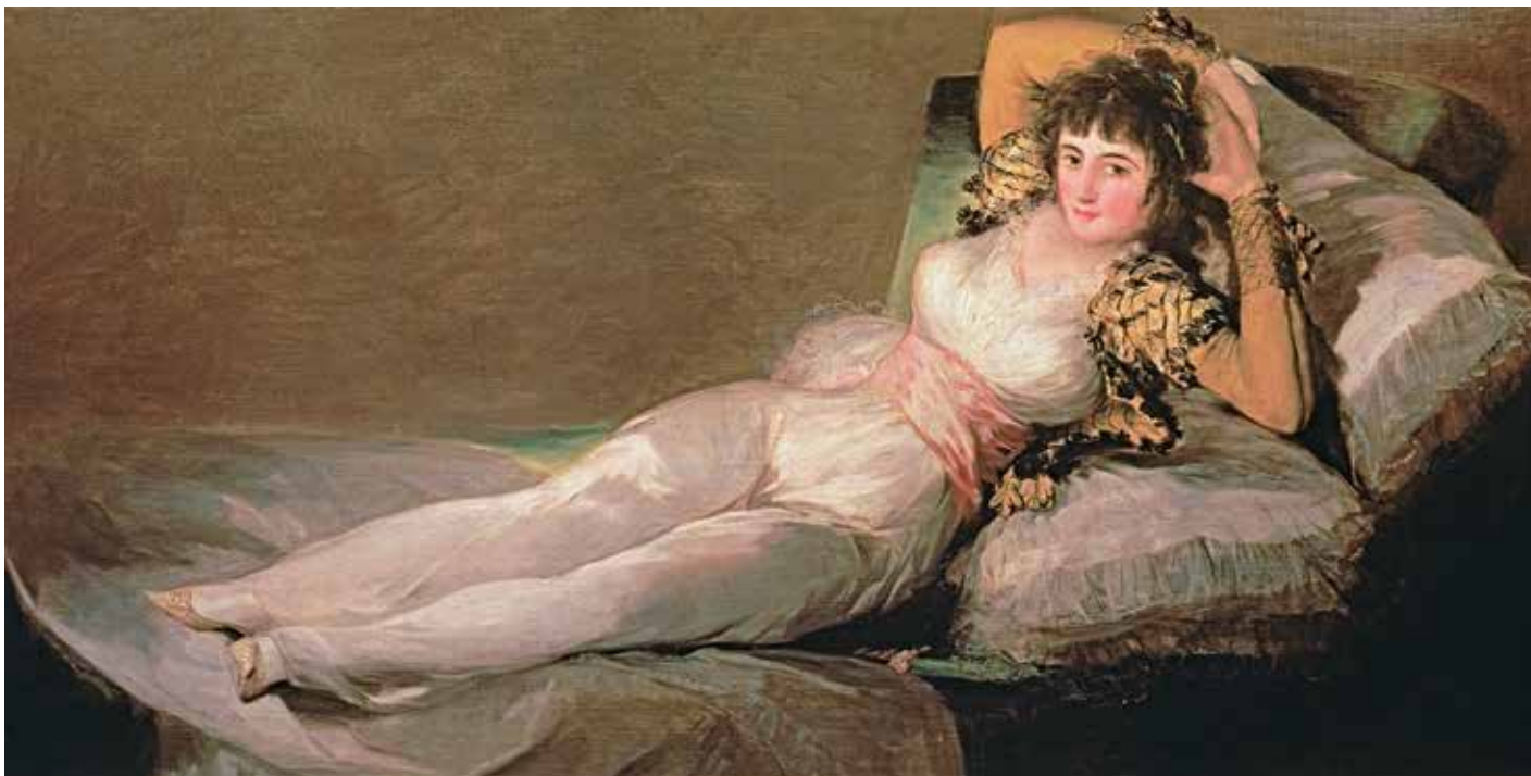
Apsirengusi macha, 1797–1800 m., aliejus ant drobės, Nacionalinis Prado muziejus, Madridas, Ispanija, 95 cm x 190 cm

Tudo. 1815 metais inkvizicija iškvietė Goją pasiaiškinti, kas gi užsakė šį paveikslą, bet jo atsakymas nežinomas.