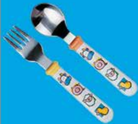
šakutė ir šaukštas