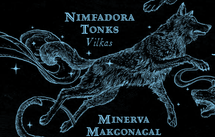
NIMFADORA TONKS Vilkas

„Grakšti ir spindinti lūšis nutūpė tarp apstulbusių šokėjų.“