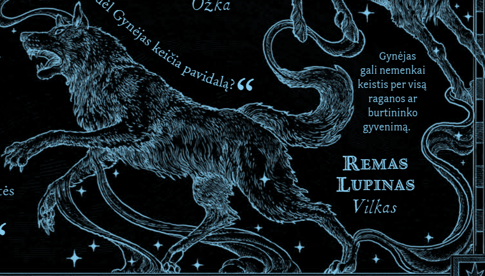
REMAS LUPINAS Vilkas

Kiekvienas Gynėjas yra unikalus ir atspindi jį išsukusią raganą ar burtininką.