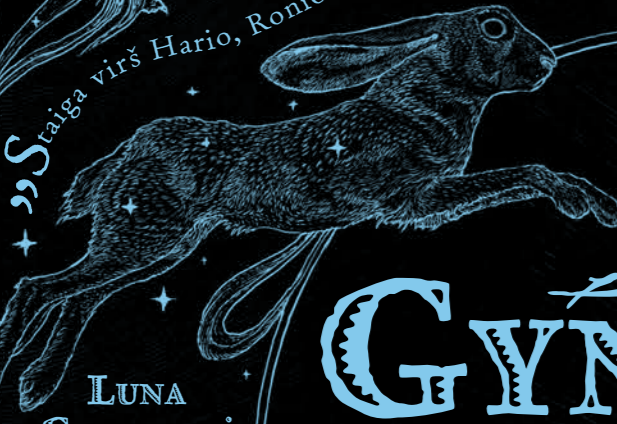
LUNA GERANORĖ Kiškis