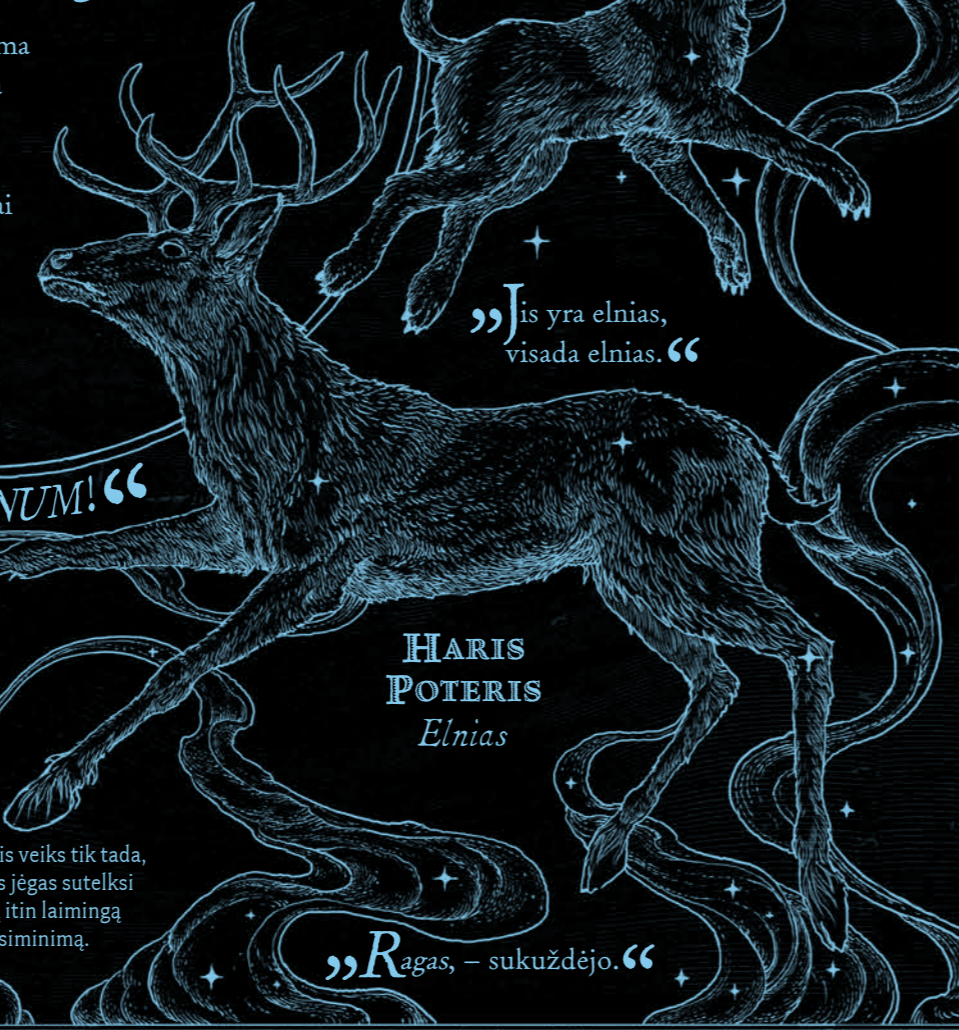
HARIS POTERIS Elnias