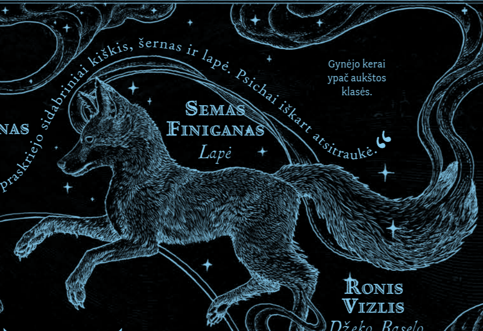
SEMAS FINIGANAS Lapė