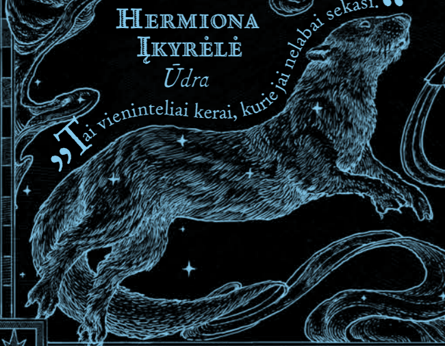
HERMIONA ĮKYRĖLĖ Ūdra

„Tai vieninteliai kerai, kurie jai nelabai sekasi.“