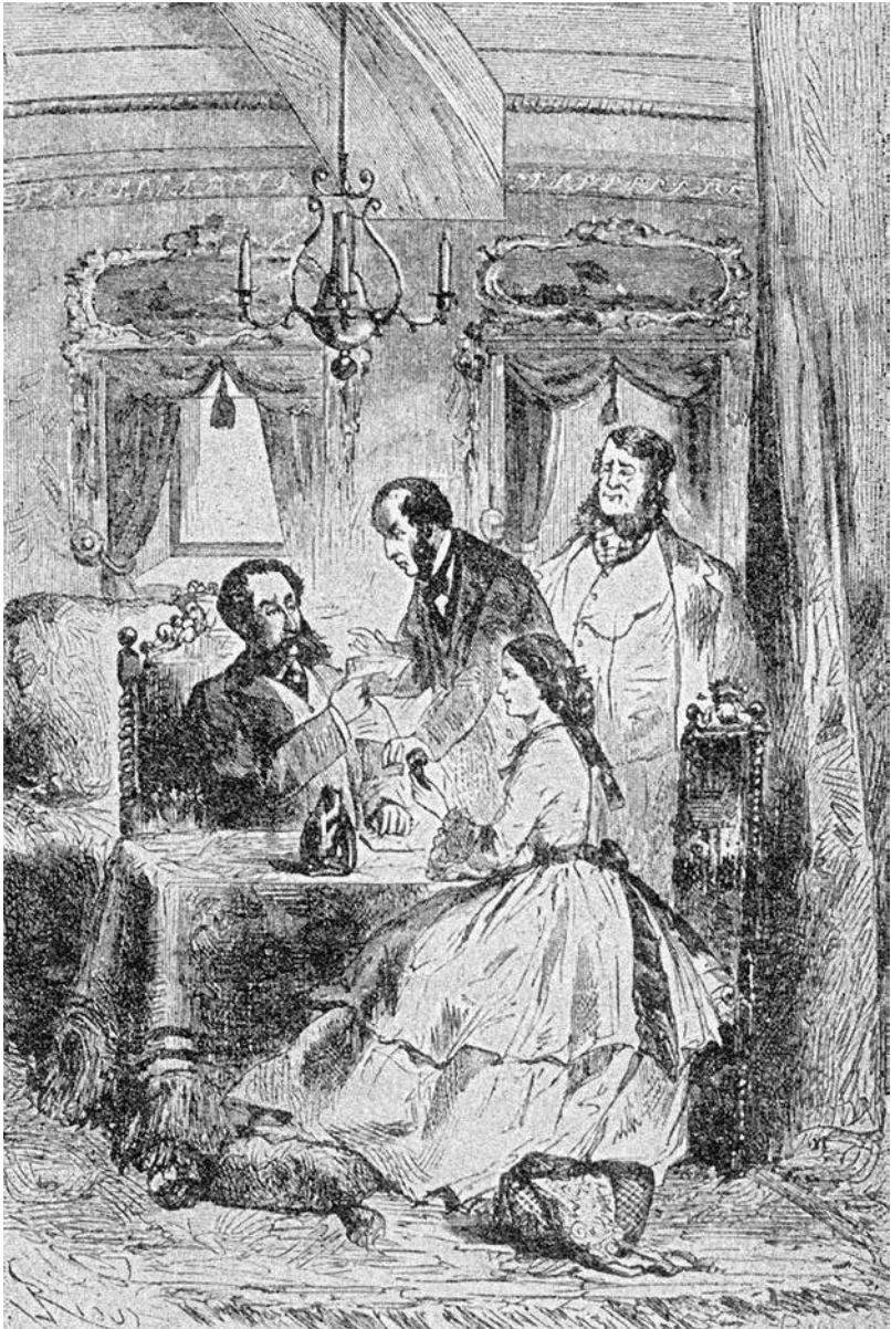
Glenarvanas atsargiai išėmė popieriaus lapelius.