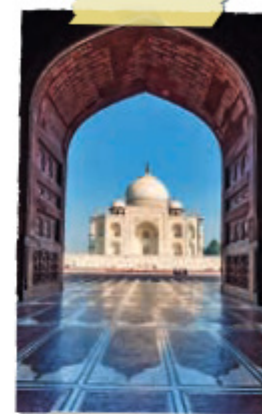
Tadž Mahalis, Agra, Indija