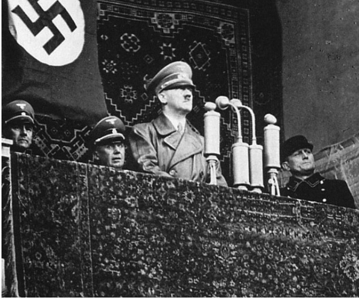
A. Hitleris kreipiasi į susirinkusiuosius iš Klaipėdos teatro balkono. 1939 m. kovo 23 d.