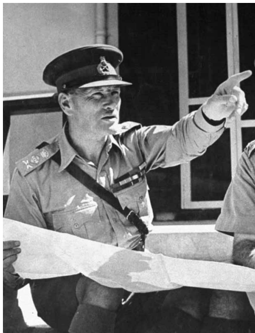
Generolas seras Claudėas Auchinleckas Afrikoje. Britų vyriausiasis Artimųjų Rytų karo veiksmų teatro vadas po virtinės nesėkmių Šiaurės Afrikoje buvo atleistas iš pareigų 1942 m. rugpjūtį per svarbią al Alameino kampaniją.