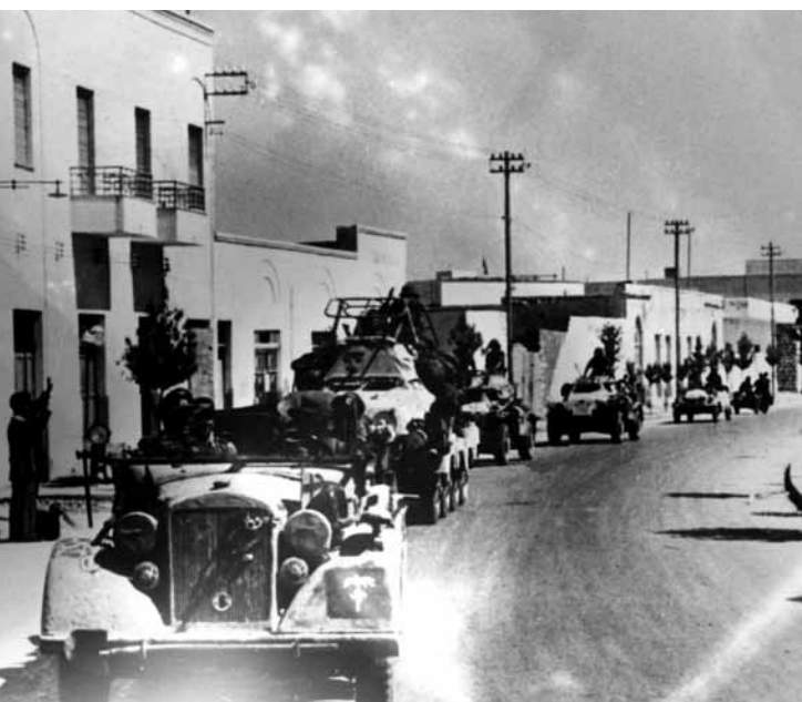
Į Bengazį (Libija) atvyko vokiečių 5-oji lengvoji (vėliau 21-oji tankų) tankų divizija, 1941 m. kovas.