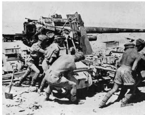
Mirtinas 88 mm zenitinis priešlėktuvinis pabūklas, kurį vokiečiai efektyviai naudojo tankų mūšiuose visoje Šiaurės Afrikos kampanijoje.