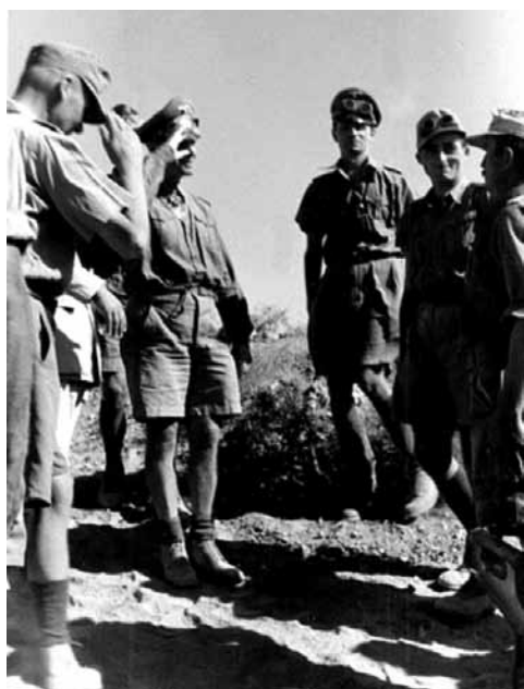
E. Rommelis (su Riterio kryžiumi) su Afrikos korpuso karininkais. Trečias iš dešinės vienas iš štabo karininkų F. W. von Mellenthinas, vėliau tapęs generolu majoru.