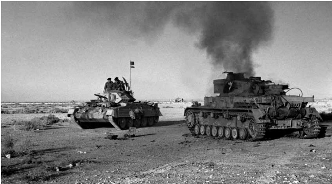
Britų „Crusader Mk I“ pravažiuoja šalia tanko Pz IV per operaciją „Crusader“, 1941 m. lapkritis.