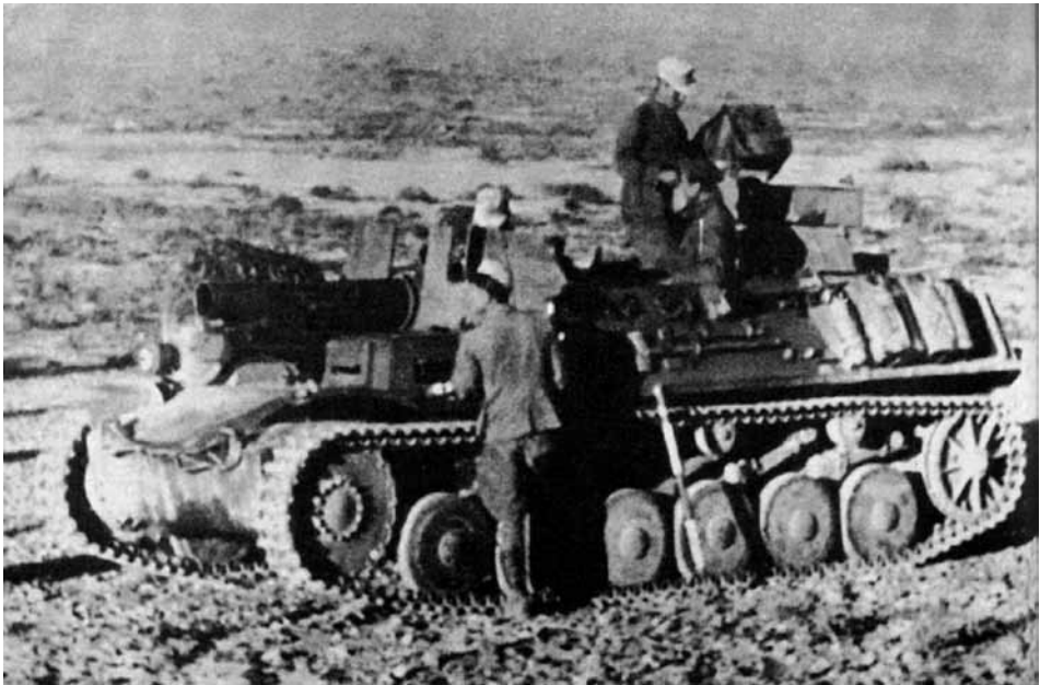
Vienas iš Šiaurės Afrikoje naudotų vokiškų šarvuotosios technikos pavyzdžių. 150 mm sunkusis pėstininkų pabūklas sumontuotas ant savaigės bazės, perdarytos iš britų lengvojo tanko „Vickers Mark III“.