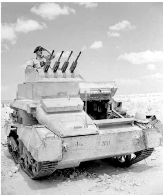
Didžiosios Britanijos lengvasis tankas AA Mk1 Afrikoje.