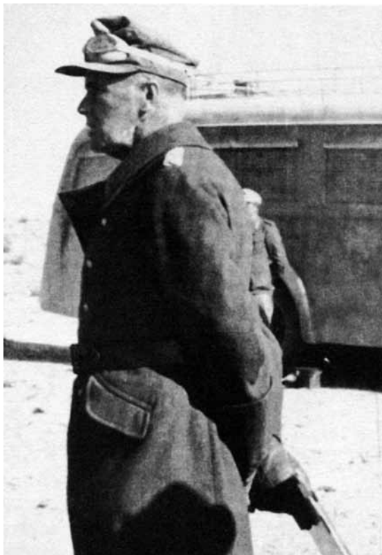
Afrikos korpuso vadas generolas L. Crüwellis al Ageiloje, 1942 m. sausis.