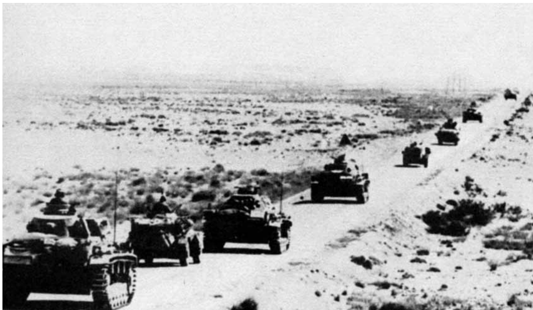
Afrikos korpuso tankų daliniai juda Mersa Bregos Libijos pakrantėje link, 1941 m.