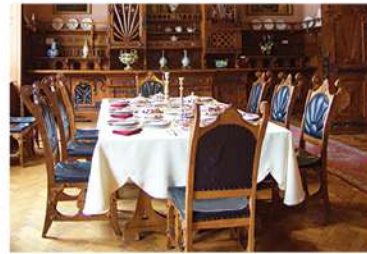
Rokiškio dvaro rūmų valgomas

Rokiškis rašytiniuose šaltiniuose pirmą kartą paminėtas 1499 m. Nepraėjęs nė 20 metų čia šeiminkauti ėmė didikai – iš pradžių kunigaikščių Krošinskių giminė, o vėliau, praėjus 200 metų, – ir grafai Tyzenhauzai. 1925 m. dokumentuose paminėta pieninė, kuri vėliau išaugo iki sūrio gamyklos ir iki pat šių dienų garsina Rokiškį.