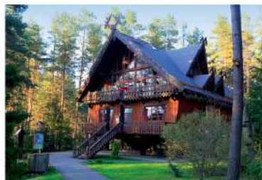
Muziejus „Girios aidas“

Miškingiausias Lietuvos kurortas ošiančių pušų akordų klausosi Džūkijoje. Tas kurortas – piečiausias šalies miestas ir sparčiausiai auganti rekreacinė vietovė. Nemuno kertama, stulbinamos gamtos ir mineralinių šaltinių čiurlenimo liūliuojama. Tai Druskininkai – seniausias ir didžiausias visus metus veikiantis Lietuvos balneologinis, purvo ir klimatinis kurortas. Ištyrus mineralinį vandenį ir mokliškai patvirtinus jo gydomąsias savybes, 1794-aisiais Druskininkams suteiktas gydomosios vietovės statusas. Čia veikia net devynios gydyklos. Masažai, sūkurinės ir purvo vonios, SPA, baseinai, pirtys, slidinėjimo trasos – tik spėk suktis. Po