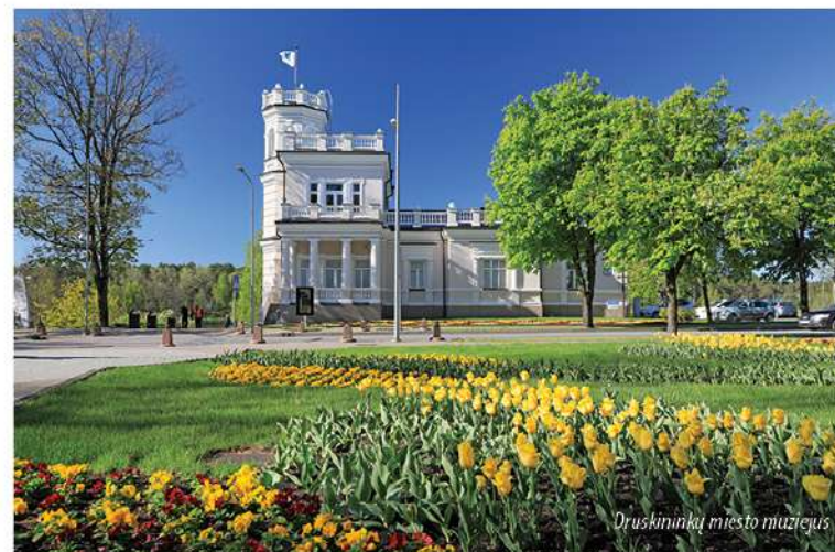
Druskininkų miesto muziejus

Vaizdingoje Druskonio ežero pakrantėje stovi itin prabangus pastatas. Vertėtų ne tik nuo gatvės pasižvalgyti, bet ir į vidų užėiti. XX a. pradžioje statytame neoklasicizmo stiliaus vasamamyje, kuris vietinių vadinamas „Linksmąja vila“, įsikūręs Druskininkų miesto muziejus . Apžiūrėkite nuo-