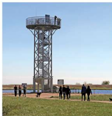
Drevernos apžvalgos bokštas