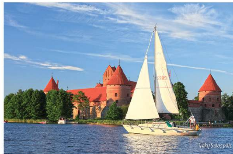
Trakų Salos pilis

Trakų Pusiasalio pilis pirmą kartą minima XIV a. viduryje. Tvirtovės statybas pradėjo Lietuvos didysis kunigaikštis Kęstutis, kad galėtų apsiginti nuo kryžiuočių antpuolių. Vėliau šioje teritorijoje buvo įkurtas vienuolynas, pastatyta bažnyčia. Dabar Pusiasalio pilis priklauso Trakų istorijos muziejui. Kasmet Pusiasalio pilies kieme rengiamos garsiosios Viduramžių šventės, kurių metu pilis atgyja: vyksta teatralizuoti vaidinimai, žaidimai, riterių kovos, skamba viduramžių muzika, šurmuliuoja persirengėliai.