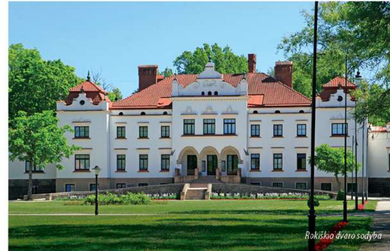
Rokiškio dvaro sodyba

Rokiškio Šv. apaštalo evangelisto Mato bažnyčios muziejuje-lobyne galima susipažinti su daugiau nei 150 brangių eksponatų, kuriuos per ilgus metus sukaupe Tyzenhauzų giminė. Visos lobyno vertybės yra įtrauktos į Kultūros vertybių registrą.