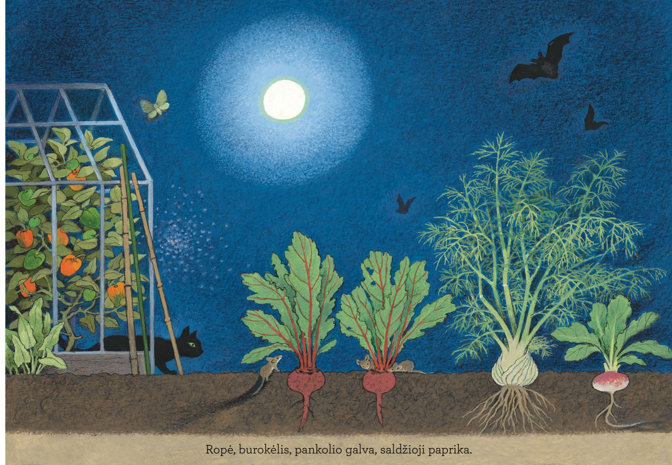
Ropė, burokėlis, pankolio galva, saldžioji paprika.