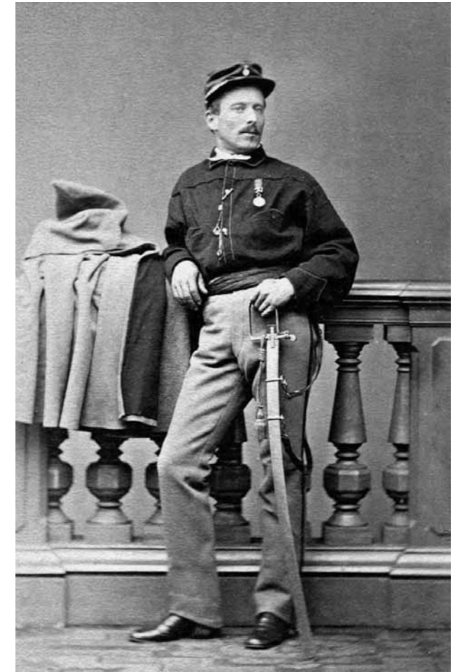
G. Garibaldžio savanorių būrio, vadinamosios Tūkstantinės , savanoris raudonais marškiniais ir su Marsalos medaliu (Marsala – miestelis Sicilijoje, kur išsilaipino G. Garibaldžio savanoriai), 1865 m.