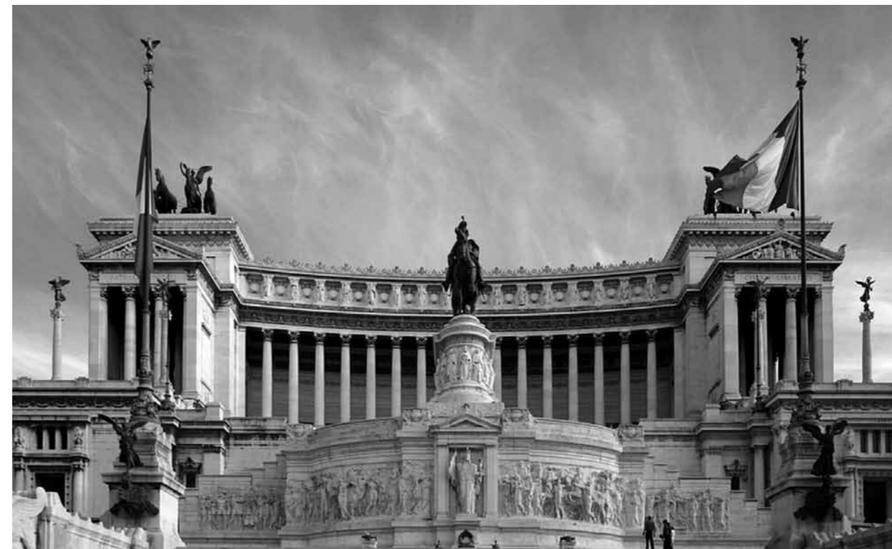
Venecijos aikštės su Viktoro Emanuelio II monumentu ansamblis Romoje. Viktoras Emanuelis II – pirmasis suvienytos Italijos karalius, perkėlęs sostinę į Romą.