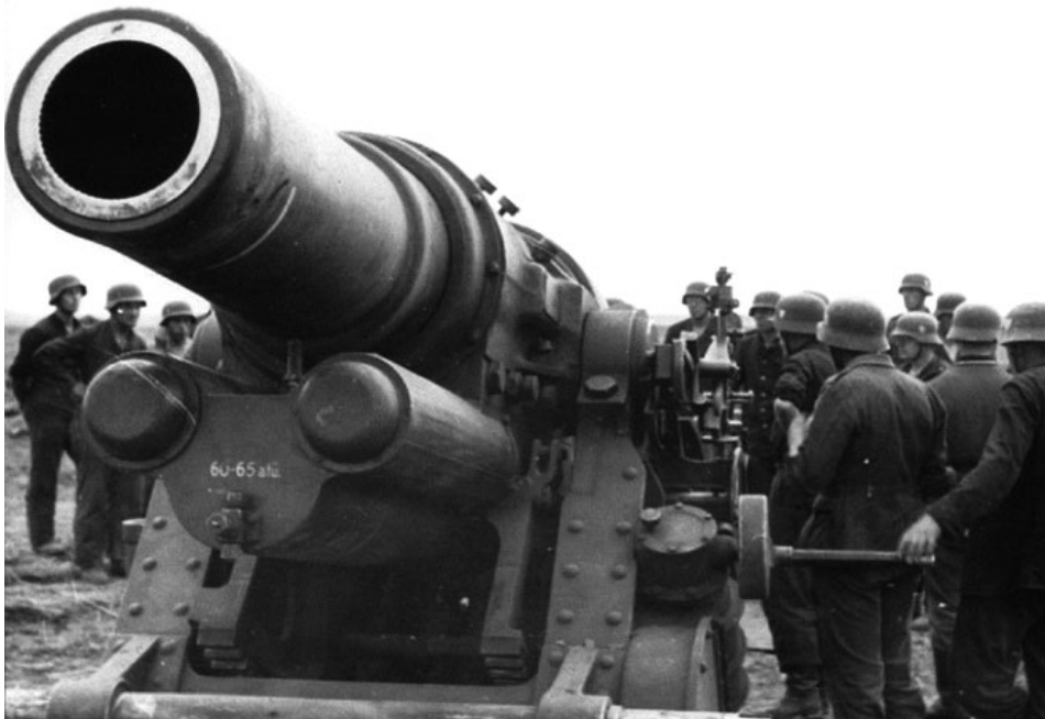
Vokiečių sunkioji artilerija Kryme.

Hitlerio nurodytų priežasčių, dėl kurių reikėjo ginti „Krymo tvirtovę“, nebuvo galima atmesti lengva ranka. Apie rugpjūčio vidurį jis