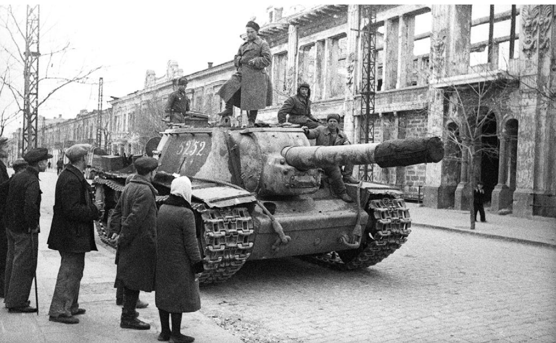
Sovietų savaeigis artilerijos pabūklas SU-152 Simferopolio gatvėje. 1944 m. balandis.

transportu. Bet kuriuo atveju šios lenktynės buvo beviltiškos, nes Jeriomenka puikiai išnaudojo savo techninį pranašumą.