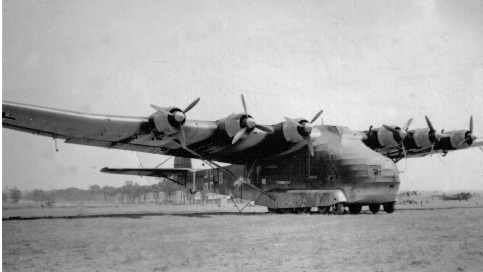
Vokiečių sunkusis transporto lėktuvas „Me-323 Gigant“.

vyriausiasis vadas grosadmirolas Dönitzas. Jis perspėjo Hitlerį, kad pasitraukimas iš Krymo iš esmės pablogins Vokietijos laivyno padėtį Juodojoje jūroje. O dėl 17-osios armijos aprūpinimo tikrai nekils sunkumų; karinis jūrų laivynas gali užtikrinti 50 000 tonų krovinių pristatymą per mėnesį. Jei vis dėlto teks kariuomenei atsitraukti, karinis jūrų laivynas irgi tuo pasirūpins. Turimais laivais galima išgabenti iki 20 000 žmonių su visa ginkluote per keturias dienas. Tai reiškia, kad visą 17-ąją armiją su 200 000 žmonių, su arkliais ir kovos technika pavyktų evakuoti per keturiasdešimt dienų, o jei oras smarkiai sugestų, išvežimas truktų apie aštuoniasdešimt dienų.