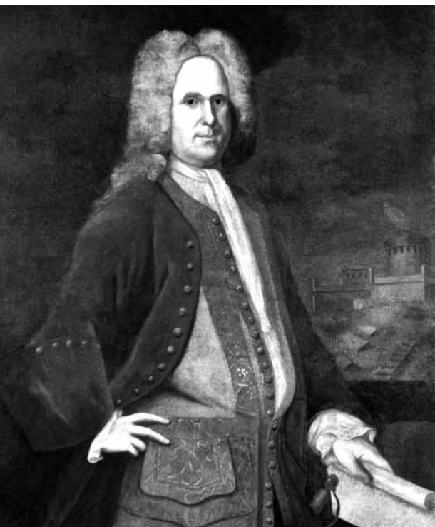
Alexanderio Spotswoodo (1676–1740), britų armijos pulkininko ir Virdžinijos gubernatoriaus, portretas. Charlesas Bridgesas, 1736 m.

34 tūkst. hektarų valstybinės žemės. Dauguma įstatymų leidėjų prieštaravo despotiškam reikalavimui vadovauti visų Anglikonų bažnyčios, oficialiosios kolonijos religijos, kunigų ir aukščiausių pareigūnų skyrimui. 1717 m. buvo atsižvelgta į įstatymų leidėjų peticiją karaliui; joje prašoma atmesti kai kuriuos Spotswoodo ekonominius reglamentus, o dabar apskritai siekta nušalinti jį nuo pareigų.