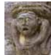
Daugybė žmogaus baimės veidų senųjų šventovių fasaduose. Aguilar de Campoo, Santander, Oviedo