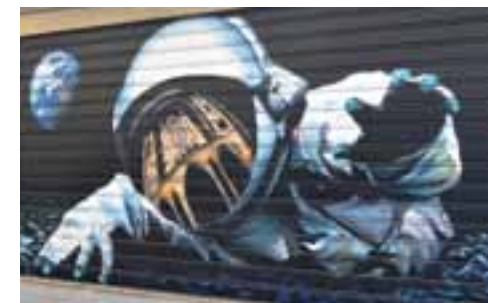
Atspindys: Leono katedra. Grafitis, León

Istorijoje būta dar vieno laikotarpio, kai žmonėms liguistai rūpėjo kilstelėti laikų pabai- gos uždangą, tai – ankstyvieji viduramžiai. Jie