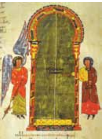
Dangaus durys uždarytos smalsuoliams. Beato de San Millan, X a. pr.

Savaime aišku, geriausiu idėjų šaltiniu dailininkai laikė Šventąjį Raštą, visuomet vedantį žmogų teisingu keliu. Tačiau tolimame krašte prieš daugybę šimtmečių sukurti Biblijos pasakojimai taip gąsdino prieštaravimais ir nerimą keliančiais veikėjais, kad menininkai pirmiausia skaitė komentarus, kaip, beje, ir pamokslininkai.