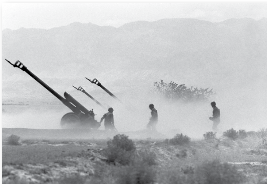
ADR pajėgos šaudė iš 122 mm kalibro sovietinių haubicų D-30. Tai buvo patikimas ginklas, kurio šaudymo nuotolis viršijo 15 kilometrų. Per visą Afganistano karo laikotarpį šiuos pabūklus naudojo ir ADR kariuomenė, ir sovietai.