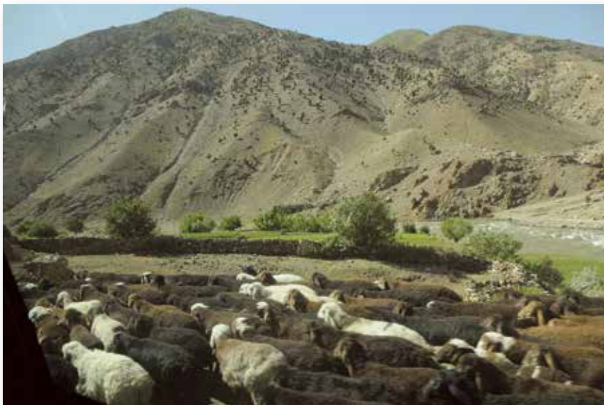
Besiganančios avys Pandžšyro slėnyje.

Kalbant apie faktines operacijas (ir puolamąsias, ir gynybines), išryškėjo keli pagrindiniai taktiniai metodai. Šie metodai buvo gerai žinomi daugumai sukilėlių pajėgų, ypač veikiančių kalnuotoje vietovėje, tačiau verta