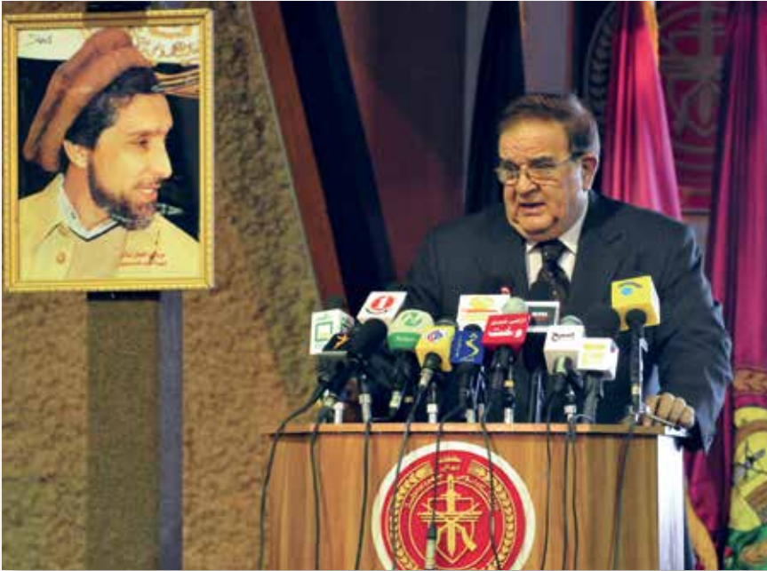
Ši nuotrauka liudija Massoudo statusą. Afganistano gynybos ministras Abdulas Rahimas Wardakas 2010 m. kreipiasi į šurą.

„Uolose jie įrengdavo pozicijas bei slėptuves, pasipriešinimo mazgus ir daugiapakopę gynybą su sumaniai išdėstytais ugnies taškais. Kalnų plyšiuose, urvuose, tarpekliuose, įgriuvose ir aukštumose atsirado pozicijų zenitinėms sistemoms ir sunkiesiems kulkosvaidžiams. Urvuose įrenginėtos slėptuvės, skirtos pasislėpti žmonėms, taip pat sandėliai ginklams, šaudmenims ir maisto atsargoms laikyti.“