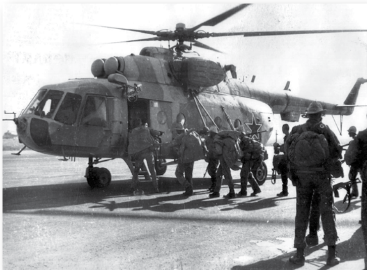
11-osios atskirosios oro desanto brigados kareiviai ruošiasi lipti į sraigasparnį Mi-8. Atkreipkite dėmesį į vadinamąsias panamas – plačiakraštes skrybėles, kurias sovietų kariai nešiojo Afganistane.

Klaidinimas reiškė klaidinantį puolimą, pradinę ataką, nukreiptą į Salangą ar kitus netoliese esančius rajonus, bet toks metodas retai pasiteisindavo.