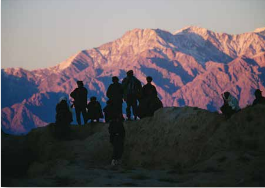
Bagramas buvo gyvybiškai svarbus miestas ir aviacijos bazė, esanti tarp Pandžšyro slėnio ir Kabulo. Šioje nuotraukoje užfiksuota, kaip kalnuose virš Bagramo stovintys sukilėliai žvelgia į miestą.

skaičių, išduoti jiems neperšaukamas liemenes, net kelis kartus per dieną keisti automobilio registracijos numerius.