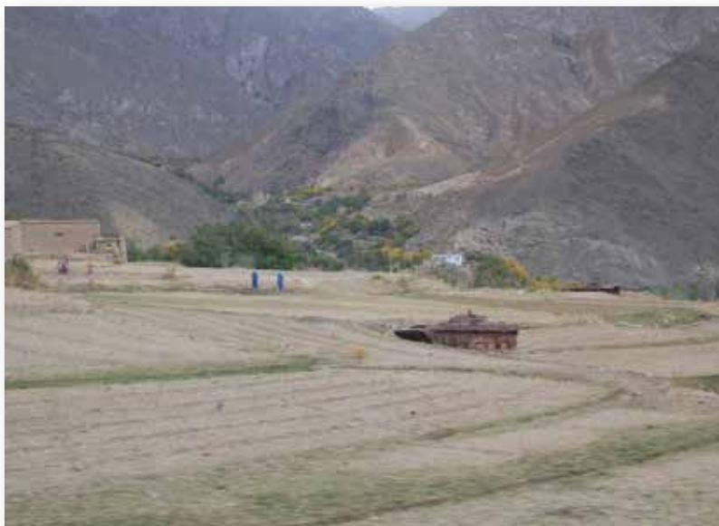
Tolumoje matyti du sudegę sovietų šarvuočiai BMP-2. Slėnyje veikusioms sovietų mechanizuotosioms pajėgoms dažnai tekdavo judėti maršrutais, kuriuose nebuvo jokių priedangų.

šaukstiniais. Ruchą užėmė beveik 1 tūkst. kareivių: mechanizuotasis batalionas, 177-ojo motorizuotųjų šaulių pulko tankų būrys, remiamas 1074-ojo artilerijos pulko D-30 2A13 haubicų ir BM-21 „Grad“ baterijų, taip pat 254-ojo specialiosios paskirties pulko radioelektroninės kovos būrys ir ADR „Sarandoy“ padaliniai. Prie įgulos taip pat prisijungęs 177-asis „specnazo“ būrys slėnyje ėmėsi agresyvaus patruliavimo.