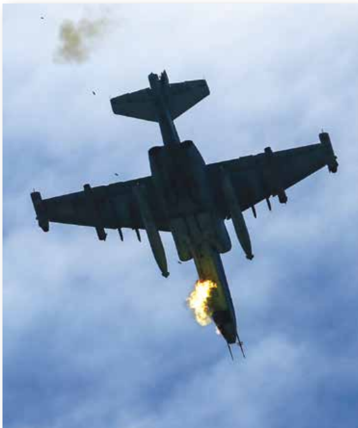
Sovietų šturmo lėktuvo Su-25 įgula šaudė iš automatinės patrankos GŠ-23. Su-25 gerai pasirodė Afganistane ir nuo 1981 m. tapo dažnu svečiu Pandžšyro padangėje.

Gegužės 17 d. 4 val. ryto sovietai ėmėsi masinio bombardavimo, kurį pradėjo dideliu aviacijos smūgiu visame slėnyje. Be naikintuvų-bombonešių Su-17 ir naikintuvų MiG-21, pirmą kartą į dangų pakelti taktiniai bombonešiai Su-24 ir šturmo lėktuvai Su-25 iš 200-ojo atskirojo šturmo aviacijos pulko. Iš esmės jų taikiniai buvo nuspėjami, tad civiliai gyventojai ir sukilėliai pasislėpė urvuose bei įrengtose slėptuvėse. Gyvenvietėms padaryta didžiulė žala, tačiau aukų nebuvo daug.