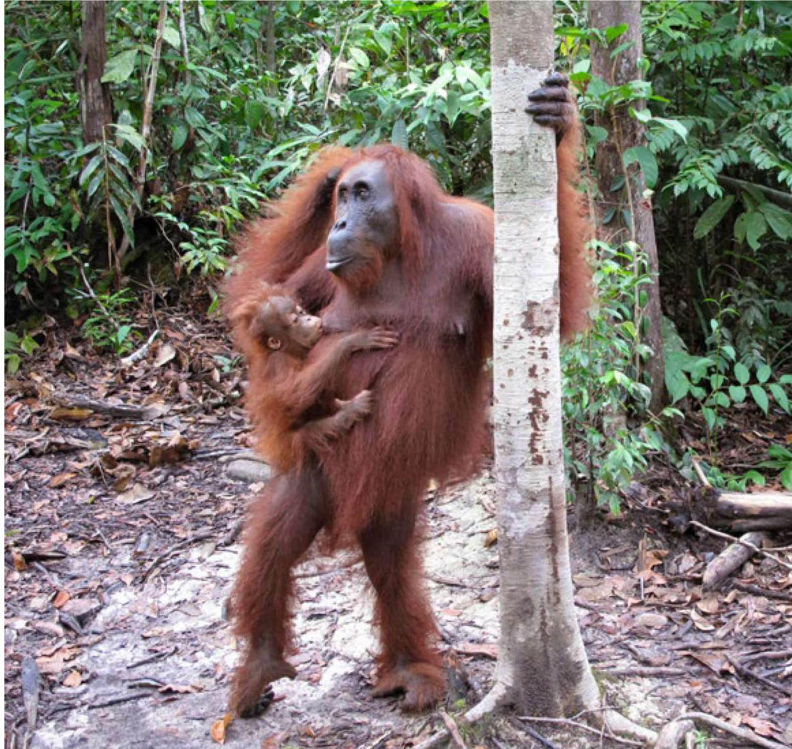
▲ Oranganè Aldona ▶ su vaiku Algiu