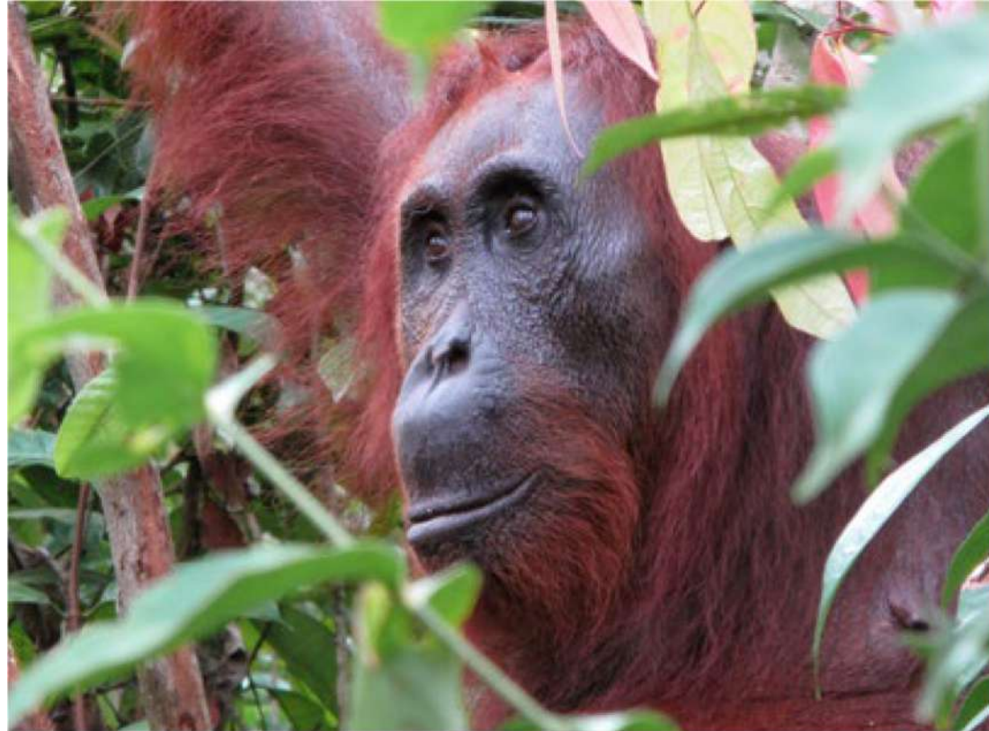
◀ Borneo orangutanas

Tačiau genetiniai tyrimai parodė, kad šios rasės yra tokios skirtingos, jog turėtume jas laikyti atskiromis rūšimis. Taigi dabar plačiai pripažįstama, kad šiandien gyvuoja ne viena, o dvi atskiros orangutanų rūšys: Sumatros ir Borneo orangutanai.