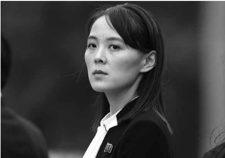
Kim Jodčong vainikų padėjimo ceremonijoje Ho Ši Mino mauzoliejuje Hanojuje (Vietnamas). 2019 metų kovo 2-oji, šeštadienis.