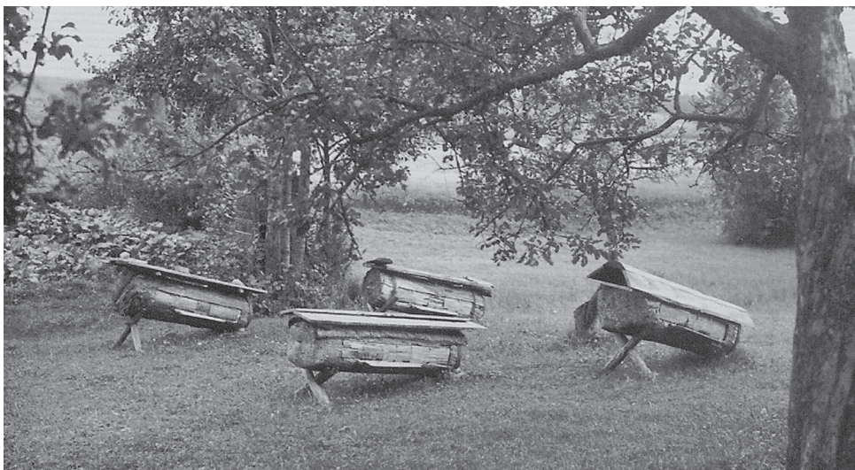
Senoviniai bičių aviliai. XX a. pirma pusė

Nuo seniausių laikų bitė lietuviams buvo darbštumo ir darbo pasidailijimo, kolektyvinio darbo pavyzdžiu. Bitės gyvena aviliuose. Motinėle vadinama bitė, kuri deda kiaušinėlius. Be motinėlės negalėtų bitės išgyventi. Šeimoje motinėlė yra tik viena. Avilyje dar yra tranai ir bitės darbininkės. Tranai – tarsi bičių tėvai. Bitės darbininkės nudirba visus darbus: neša vandenį, iš gėlių renka nektarą, iš jo atsiranda medus, taip pat renka žiedadulkes – iš jų gamina bičių duoną. Bitės darbininkės maitina ką tik iš kiaušinių išsiritusias biteles, gamina vašką, kitas bičių gyvenimui reikalingas medžiagas. Bitė ne tik darbšti, bet ir mėgsta švarą, dažnai puola suprakaitavusį, nevalyvą žmogų. Daugeliu atžvilgių bitės gyvenimas panašus į žmogaus: jos gyvena šeimomis, dirba naudingą darbą, tvarkosi ir t. t., todėl apie bites sakoma ne „gaišta“, o „miršta“.