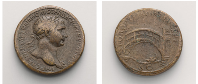
99 pav. Romėnai savo statinius mėgo vaizduoti monetose. Šios monetos vienoje pusėje pavaizduotas Trajanas, kitoje – tiltas, pastatytas tikriausiai per Dunojaus upę.