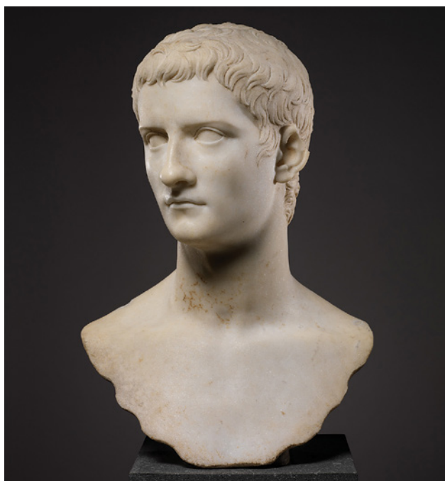
85 pav. Imperatoriaus Kaligulos, valdžiusio I a. po Kr., biustas

ar pečių, atvaizdų (85 pav.). Biuste svarbiausia žmogaus galva, veidas, atspindintis jo būdo savybes ir nuotaikas (86 pav.). Romėniški atvaizdai tikroviškesni nei graikiški, jais nesiekama vaizduoti tobulo grožio, žmonės vaizduojami tokie, kokie yra, dažnai ne itin idealių bruožų, pasižymintys jiems būdingais kūno ypatumais. Žinoma, buvo ir viso ūgio statulų, vaizduojančių tiek eilinius žmones, tiek imperatorių (palyginkite su 29 pav., p. 100). Jos turėjo visų pirma pasakoti apie tuos žmones ir daryti įspūdį. Romėnų politikų statulas galime lyginti su dabartinių politikų nuotraukomis. Jos turi panašumų, nes išryškina tam tikras detales, svarbias būdo savybes. Svarbu ir pakelta vaizduojamo asmens ranka – jis kreipiasi į klausytojus laikydamasis retorikos taisyklių (palyginkite su 16 pav., p. 92). Juk ir jūs kalbėdami prieš klasę nestovite sustingę, nuleistomis rankomis.