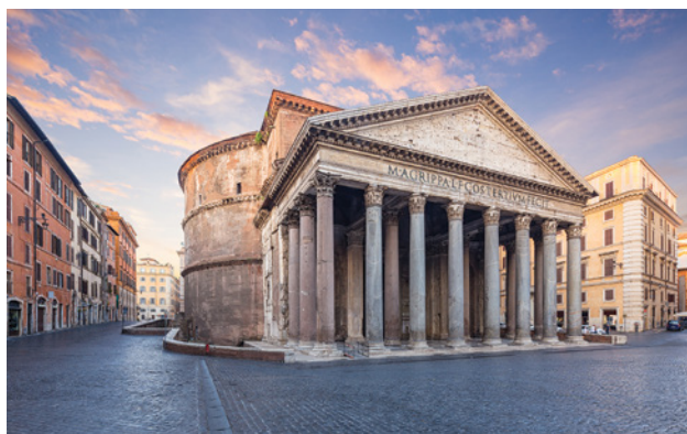
96 pav. Panteono priekis primena graikišką šventyklą, bet toliau patenkama į didžiulę apskritą salę, dengiamą kupolo.

Šis ir kiti įspūdingi statiniai buvo pastatyti romėnų inžinierių, sugebėjusių panaudoti kitų laimėjimus ir pralenkti savo mokytojus – graikų ir etruskų architektus. Vienas iš pagrindinių romėnų išradimų yra betonai. Jį gamino iš negesintų kalkių, vulkaninės kilmės smėlio ir kelių kitų priemaišų, įpilant vandens. Sukietėjęs mišinys buvo labai tvirtas ir atsparus vandeniui, puikiai tiko vandens statiniams – prieplaukoms, molams, krantinėms, tiltams ar vandentiekiams.