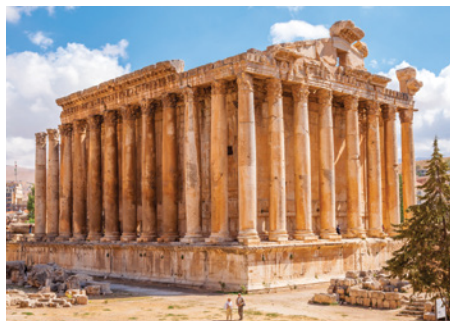
94 pav. Bakcho šventykla Baalbeke (dab. Libānas) – viena iš išpūdinčiausių romėnų laikų šventyklų.

Romėnų pastatai daug kuo priminė graikų statinius. Išties romėnai iš dalies perėmė graikų architektūros tradiciją. Iš pirmo žvilgsnio romėnų šventyklos didelėje Romos imperijos teritorijoje labai panašios į graikų, turinčios tokių pačių bruožų, kaip antai dvišlaitį stogą ir kolonas (94 pav.). Vis dėlto pirmųjų romėnų šventyklų architektūrą visų pirma veikė etruskų šventyklos. Jos buvo statomos iš medžio ir molio plytų, nes Romoje nebuvo tokios