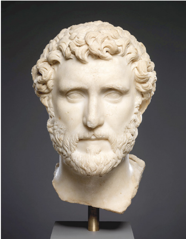
87 pav. Imperatorius Antoninus Pijus pavaizduotas su barzda, taigi – jis puikiai išsilavinęs!

Statulos Romoje, kaip ir Graikijoje, buvo daromos ne tik iš akmens, bet ir iš bronzos. Vis dėlto tik maža dalis bronzinių statulų išliko, nes vėliau, Viduramžiais, buvo išlydytos – žaliava svarbiau nei tokios nenaudingos senienos! Žinoma, keičiantis laikams keitėsi mados. Štai Oktavianas Augustas nevaizduotas su barzda, nes tuo metu tai buvo nepriimtina ir neatitiko Romos tradicijų. Vėliau, norint parodyti imperatorių išsilavinimą ir