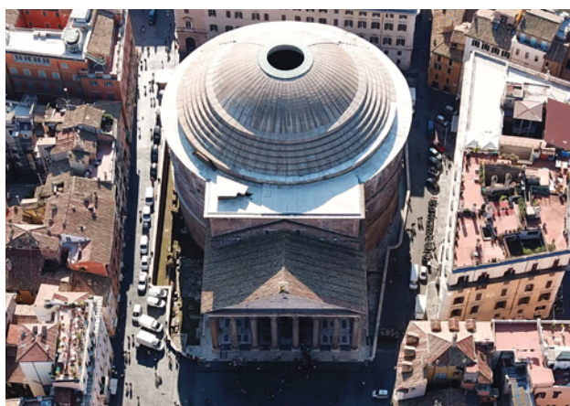
97 pav. Įspūdingas Panteono kupolas – romėnų inžinerijos stebuklas. Kaip jis taip laikosi?