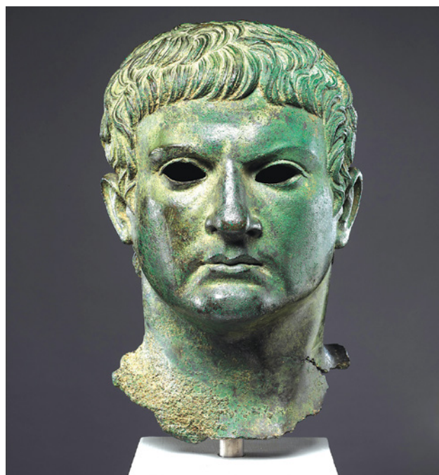
86 pav. Kokiomis būdo savybėmis pasižymėjo šis vyras?