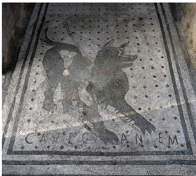
92 pav. Mozaikoje šuo ir užrašas „Cave canem“ (saugokis šuns)! Gal šį įėjimą į vilą Pompėjuose išties saugojo šuo?