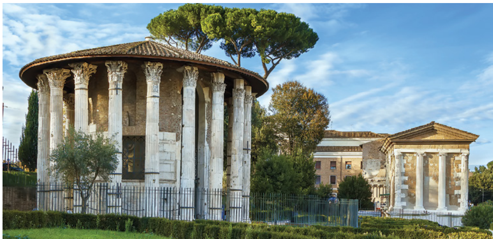
95 pav. Kairėje apvali Herkulo (graik. Heraklio) šventykla (iš dalies rekonstruota), dešinėje – dievo Portūno šventyklos galas (palyginkite su 52 pav., p. 115).

geros kokybės akmens kaip Graikijoje. Vėliau, Oktaviano Augusto laikais, pradėtos statyti šventyklos iš marmuro, tačiau jos buvo kiek kitokios nei Graikijoje – aukštesnės, ant aukšto, apie 3 m aukščio, pagrindo ir plonesnės, ir vidinės patalpos kiek skyrėsi nuo graikų šventyklų. Paprastai romėnų šventyklos turėjo tik priekinį įėjimą ir kolonas tik priekyje, o šonuose buvo puskolonės – kolonos, įmūrytos į sienas (palyginkite su 52 pav., p. 115). Kolonų stilius romėnai perėmė iš graikų (palyginkite su 73 pav., p. 56), bet kiek pakeitė ir pritaikė savo skoniu.