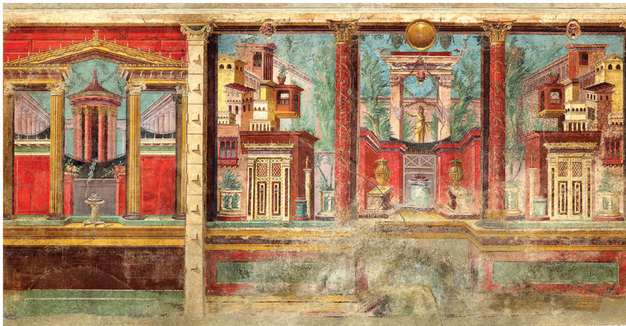
89 pav. Čia nedidelis miegamasis ar nuostabi erdvė poilsiui stebuklingame mieste (vilos prie Pompėjų sienų tapyba)?

padidindavo patalpos erdvę (89 pav.). Gražu ir galima pasipuikuoti prieš svečius! O kokia sienų tapyba jūs papuoštumėte savo kambarį?