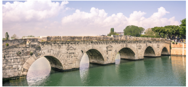
98 pav. Riminio mieste, Italijoje, Oktaviano Augusto ir Tiberijaus laikais pastatytas tiltas vis dar naudojamas pėsčiųjų ir lengvųjų automobilių eismui.

Taigi betonas puikiai tiko įvairių arkų ir kupolų statybai, nes tvirtai sulipdydavo akmenis ar degto molio plytas. Buvo galima kurti lengvesnius, bet itin tvirtus statinius. Be betono romėnai nebūtų pastatę ir tokio sudėtingo statinio kaip Koliziejus. Betonas ypač pravertė statant tiltus, o jų romėnai imperijoje, manoma, pastatė apie 2 000 (98 pav.). Štai imperatorius Trajanas liepė pastatyti tiltą per Dunojaus upę, kad nauja provincija Dakija būtų lengviau pasiekama. Tiltas išties buvo įspūdingas – apie 1 km ilgio, remiamas 20 mūrinių atramų (99 pav.). Iš įspūdingų, geriau ar blogiau išlikusių romėnų statinių vėliau mokysis ir juos iš dalies kopijuos daugelis architektų ir inžinierių. Gal panašių statinių rasite savo mieste ar gyvenvietėje?