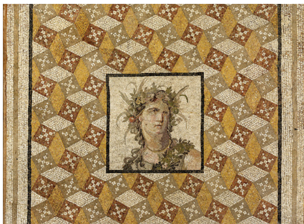
90 pav. Įdomu, kiek akmenukų šioje daugiau kaip 5 m 2 ploto grindų mozaikoje ir kiek laiko truko juos sudėti?