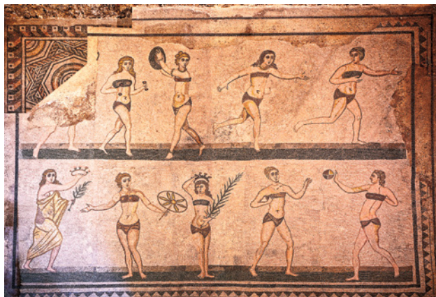
91 pav. Vienos iš vilų Sicilijoje savininkas nusprendė geometrinių vaizdų mozaiką (kampas kairėje viršuje) pakeisti įdomesne (ir tokia vienintele!) – maudymosi kostiumėliais vilkinčios merginos sportuoja ir varžosi, o nugalėtojos apdovanojamos.

Romėnų vilas puošė ir įvairiausios mozaikos – grindų, vėliau ir sienų, paveikslai, sudėlioti iš nedidelių įvairių spalvų akmenukų, stiklo kubelių ar kitų medžiagų. Ši puošybos technika nebuvo romėnų išradimas, ji žinota anksčiau, bet romėnų laikais ištobulinta. Romoje mozaiką pradėta kurti II a. pr. Kristų. Ji buvo mėgstama per visą valstybės gyvavimo istoriją ir netgi vėliau. Kaip sienų tapybos, taip ir mozaikos būta įvairiausių stilių. Čia galėjo būti ir paprastų geometrinių (90 pav.), ir labai sudėtingų vaizdų, atspindinčių įvairias romėnų gyvenimo akimirkas (91 pav.) ar mitų scenas (palyginkite su 82 pav., p. 131). Mozaikos galėjo būti ir spalvotos, ir nespalvotos – romėnų kasdienybės vaizdai iš didelių pikselių (92 pav.)!