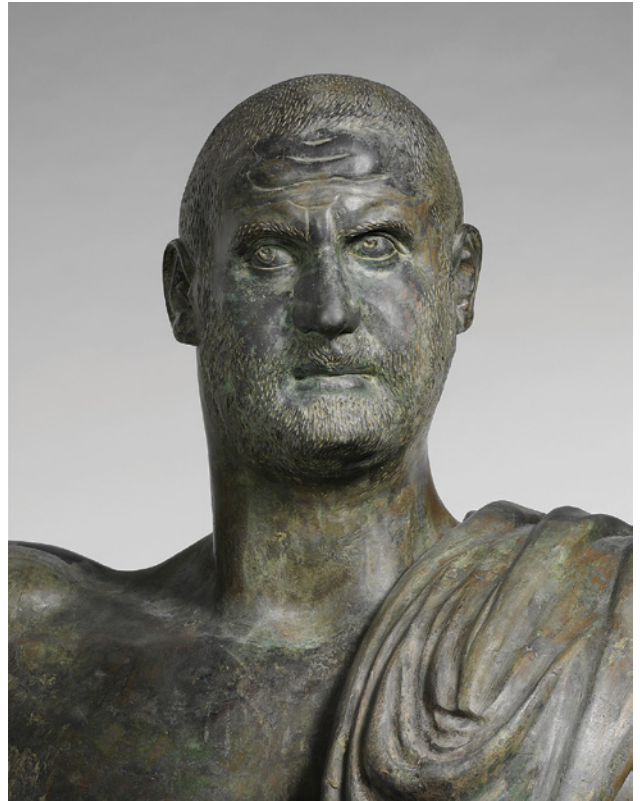
88 pav. Imperatoriaus Treboniano Galo (III a. po Kr. vidurys) bronzinės statulos dalis. Ši jo statula tik viena iš kelių išlikusių. Ji beveik 2,5 m aukščio.

Statulos Romoje, kaip ir Graikijoje, buvo daromos ne tik iš akmens, bet ir iš bronzos. Vis dėlto tik maža dalis bronzinių statulų išliko, nes vėliau, Viduramžiais, buvo išlydytos – žaliava svarbiau nei tokios nenaudingos senienos! Žinoma, keičiantis laikams keitėsi mados. Štai Oktavianas Augustas nevaizduotas su barzda, nes tuo metu tai buvo nepriimtina ir neatitiko Romos tradicijų. Vėliau, norint parodyti imperatorių išsilavinimą ir