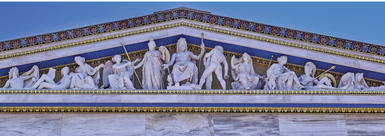
Atėnų nacionalinės akademijos frontono fragmentas su graikų dievais ir deivėmis