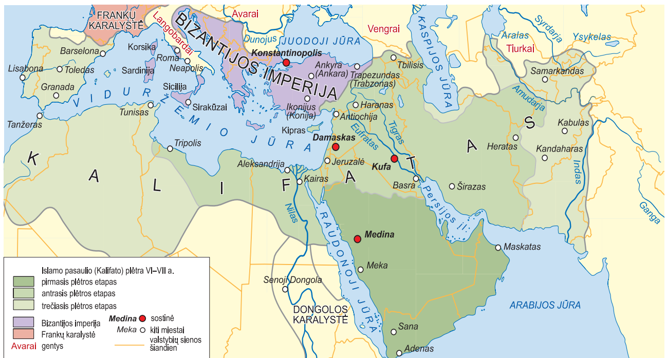
8 pav. Frankų karalystė, Bizantijos imperija ir Kalifato valstybės plėtra VII-VIII a.

Viduramžiais Europa ribojosi su dviem didžiosiomis kultūromis – Bizantijos ir islamo pasaulio (8 pav.) – ir patyrė jų įtaką. Tolesnėse temose dau-