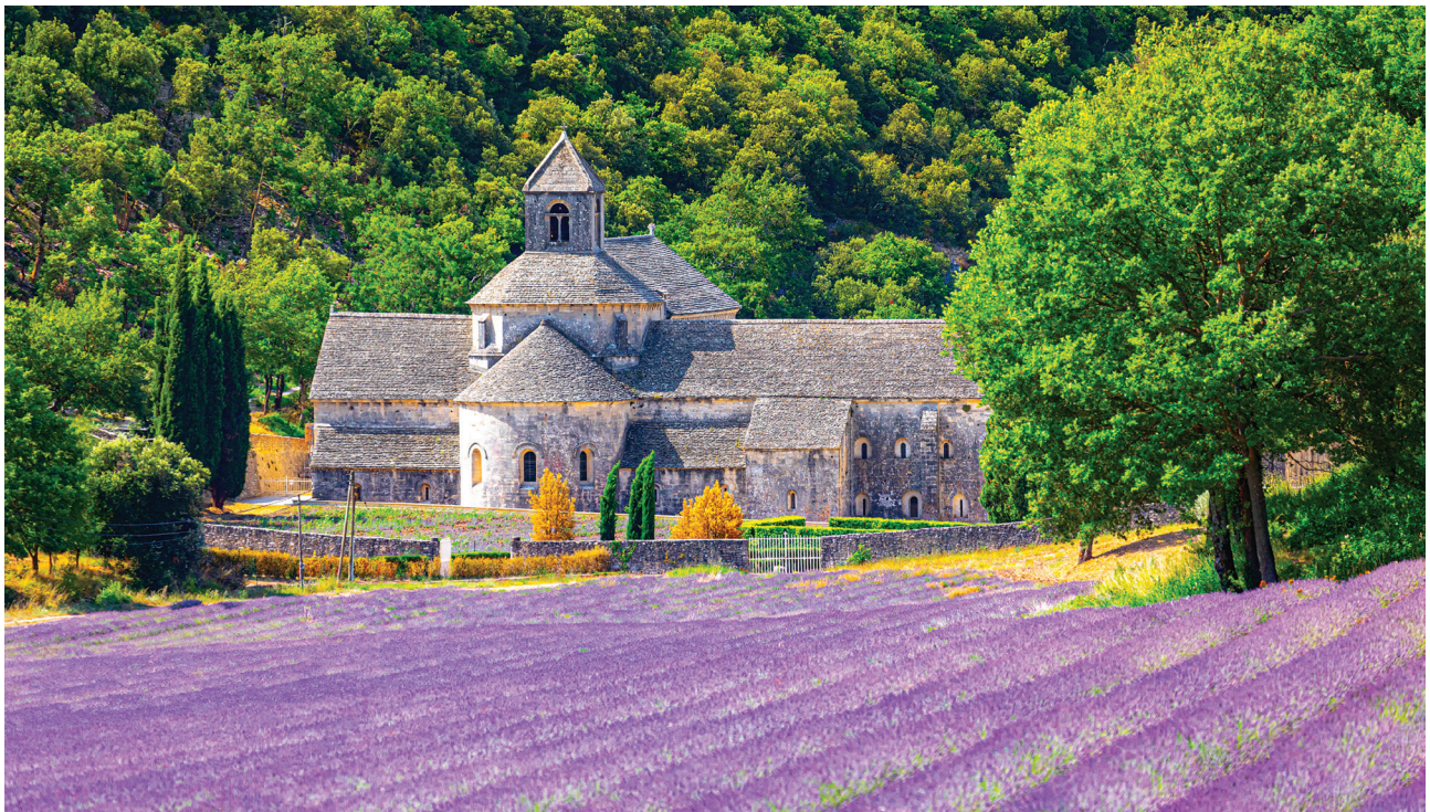
6 pav. Senankės cistersų vienuolynas, pastatytas XII a. vid., Prancūzijoje.

Valstybių Europoje kūrimas ir valdovų karūnavimas tiesiogiai susijęs su religija, tiksliau – su krikščionybė. Karūnacija skatino krikščionybės plėtrą Europoje. Krikštą priimdavo valdovas ir jo aplinka, o ilgainiui ir visuomenė. Per kelis šimtmečius krikščionybė tapo vyraujančia Europos žemyno religija.