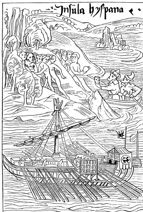
1 pav. Kristupas Kolumbas atranda vieną iš dabartinės Centrinės Amerikos salų, medžio raižinys, XVI a. pr.

O Viduramžių pabaigą rodo net keletas istorinių įvykių. Pirmasis – kultūrinis. XV a. viduryje buvo išrastas spausdinimo presas ir pradėtos spausdinti knygos. Antrasis – politinis. 1453 m. musulmonai turkai seldžiukai užėmė Konstantinopolį, Bizėntijos sostinę, ir daugiau kaip tūkstantį metų gyvavusi Rytų Rėmos imperija galutinai žlugo. Trečiasis – visuotinis. 1492 m. Kristupas Kolumbas (isp. Cristóbal Colón, it. Cristoforo Colombo) per ekspediciją į Indiją atrado Amerikos žemyną (1 pav.). Ketvirtasis – religinis. 1517 m. vienuolis Martynas Liuteris (Martin Luther) prie Vitenbergo katedros durų