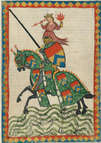
3 pav. Eiliuoto Viduramžių teksto „Codex Manesse“ iliustracija – vaizdinis šaltinis. Jame vaizduojamas kilmingas riteris, rankraščio miniatiūra, XIV a. pr.