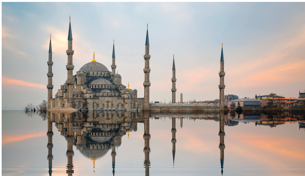
10 pav. Sofijos šventovė Stambule pastatyta VI a. pirmoje pusėje kaip stačiatikių soboras, musulmoniški minaretai pristatyti XV–XVI a., Turškija.

patriarcho nesutarimai baigėsi Bažnyčios skilimu. Romos katalikų ir Konstantinopolio stačiatikių Bažnyčios galutinai atsiskyrė. Pirmojoje tiek pasaulietiniame, tiek religiniame gyvenime vyravo lotynų kalba, antrojoje – graikų. Atsiradusią aiškią skirtį tarp Romos katalikų ir Konstantinopolio stačiatikių dar aptarsime išsamiau.