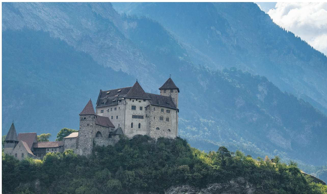
5 pav. Pilis buvo ir tebėra Viduramžių valdžios ir galios ženklas. Gutenbergo pilis pirmą kartą rašytiniuose šaltiniuose paminėta XII a., Lichtenšteinas.

VI–X a. Vakarų Europoje kūrėsi pirmieji politiniai dariniai, pirmosios valstybės (kunigaikštystės ir karalystės) (5 pav.). Valstybių valdovai buvo karūnuojami. Ir Lietuvos valstybės kūrimasis priklauso tam pačiam procesui. XIII a. viduryje kunigaikštis Mindaugas priėmė krikštą ir pradėjo kurti valstybę, buvo karūnuotas kaip Lietuvos karalius.