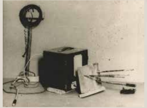
50. Prancūzų radijas kodiniu pavadinimu „Artūras“, kontrabanda įvežtas į pilį maisto pakuotėse.