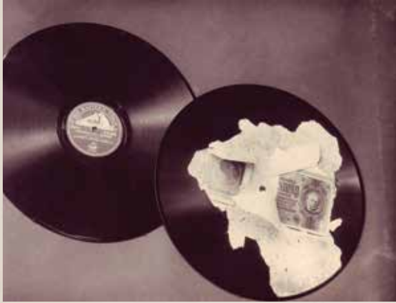
49. Vokiški pinigai, paslėpti gramofono plokštelėse.