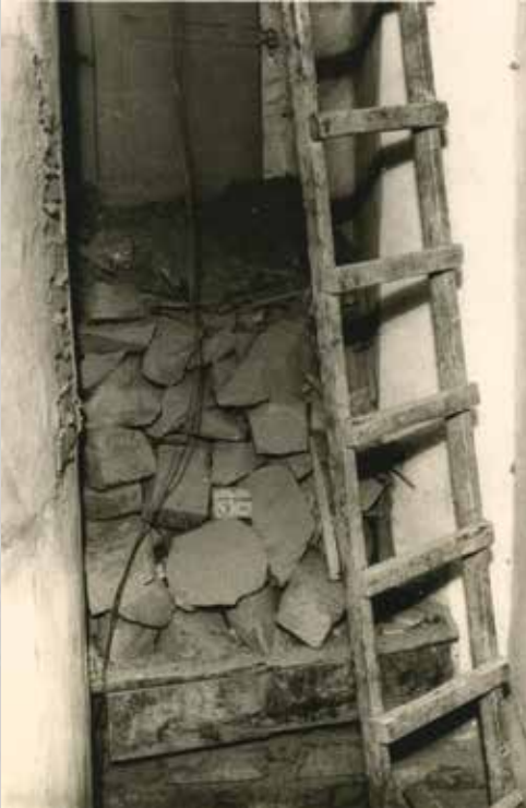
53. Nuolaužos ir kopėčios, rastos laikrodžio bokšte po sužlugdyto prancūzų pabėgimo.