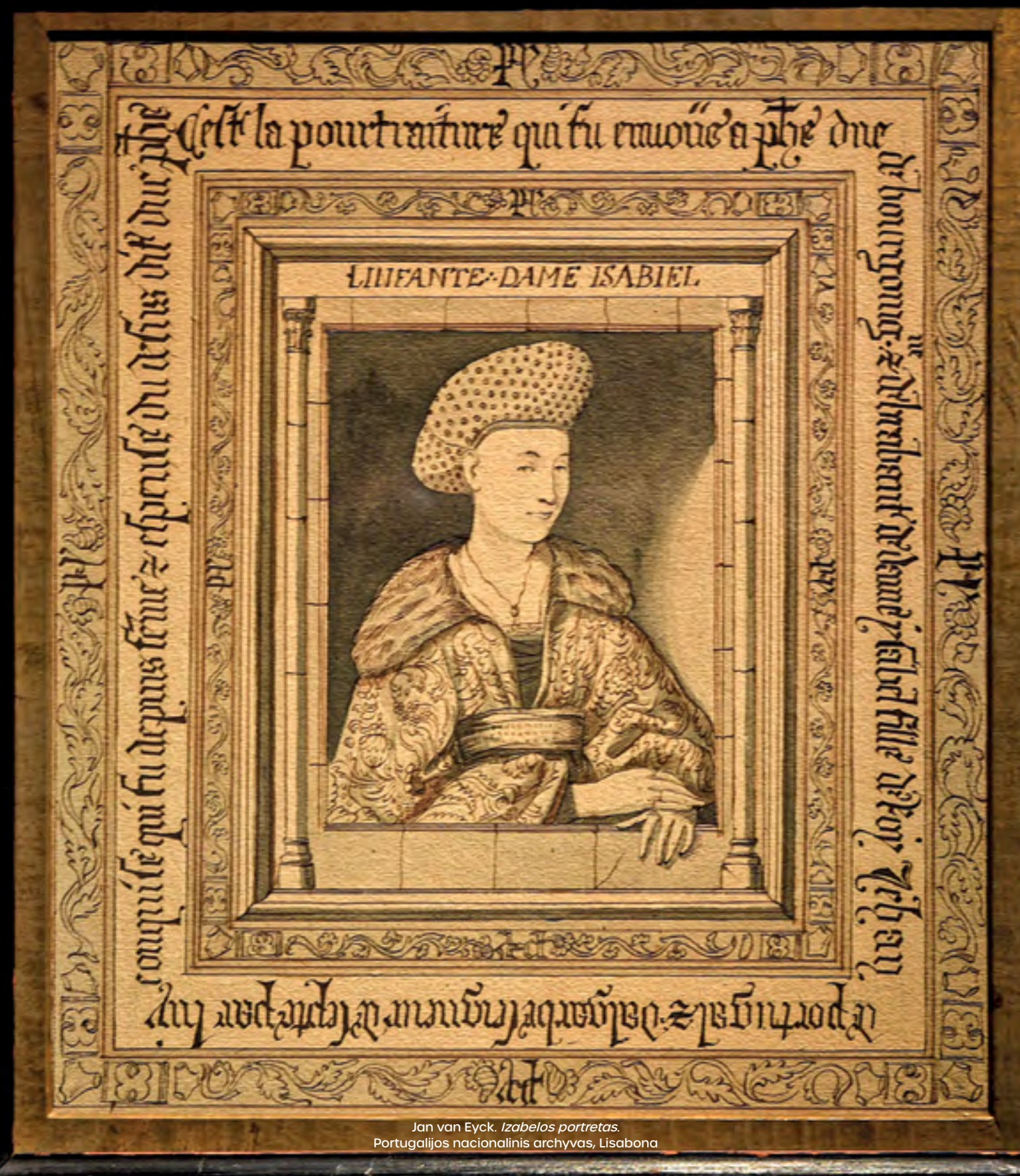
Jan van Eyck. Izabelos portretas . Portugalijos nacionalinis archyvas, Lisabona

D'APRÈS JEAN VAN EYCK COPIE D'UNE IMAGE DE PORTRAIT REPRO DUISABELLE DE PORTUGAL