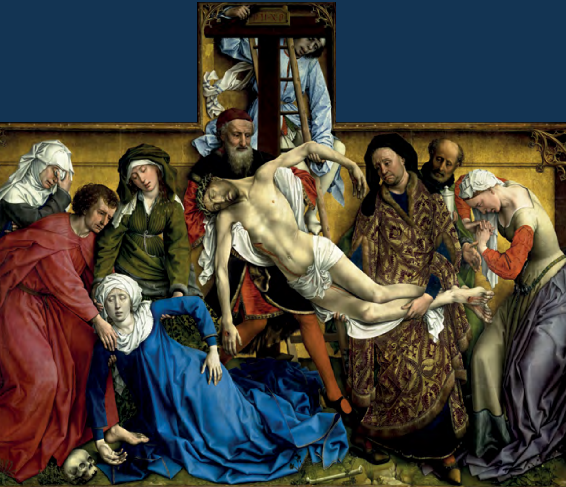
Rogier van der Weyden. Nuėmimas nuo kryžiaus. 1435. Prado muziejus, Madridas