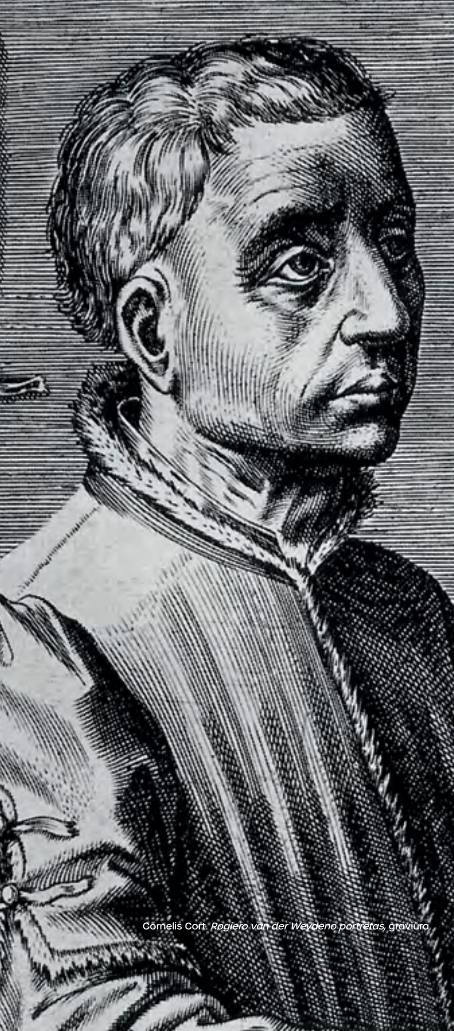
Cornelis Cort: Rogiero van der Weydeno portretas, gravūra

Vienas svarbiausių Burgundijos Nyderlandų miestu netrukus tapo Briuselis, o ten ryškiausiai švietė Rogiero van der Weydeno, 1436 metais paskirto oficialiu Briuselio dailininku, žvaigždė.