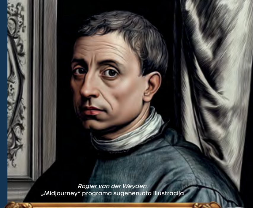
Rogier van der Weyden.

Drauge pradėdame antrąjį „Senujų Meistrų paveikslų istorijų ir paslapčių“ sezoną. Pirmajame sezone aš, kaip nepatyręs režisierius ir scenarijaus autorius, ne labai žinojau, ką čia darau, todėl paveikslų aprašymai šokinėjo kaip vaikai ant gimtadienio batuto – nuo ankstyvojo Renesanso iki baroko ir atgal į Renesanso piką, – tai dabar viskas bus logiškiau. Ramiai ir nuosekliai keliausime nuo XV amžiaus iki pačios pačios Senujų Meistrų pabaigos, kai J.M.W. Turneris XIX amžiaus viduryje tapė savo „Kovos laivą Temeraire “.