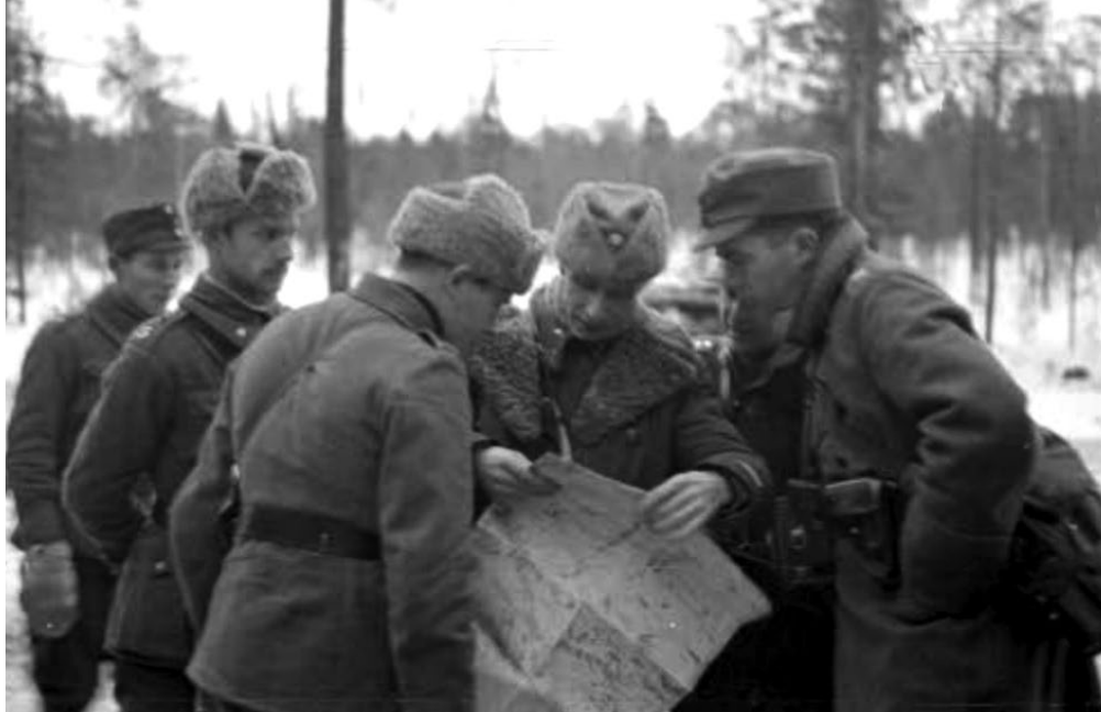
Suomijos karininkų grupė planuoja veiksmus prie Suomusalmio. 1939 m. gruodis.

rytą baigti evakuoti Suomusalmio gyventojai. Dauguma pastatų buvo sudeginti. Deja, gynėjai darbavosi paskubomis, tad pelenais virto ne visi namai. Išliko nemažai pastatų, juose galėjo įsikurti keli šimtai vyrų. Be to, kontratakaujantiems suomiams vėliau teks tvarkytis su dėl gatvių kautynių kilusiais sunkumais.