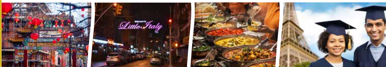
kinų kvartalas Mančesteryje

Pasaulio dalys savitos ir skirtingos, tačiau žmonėms daug keliaujant, keičiantis informacija, keičiant gyvenamąją vietą daug kas supanašėja, vienų šalių kultūros bruožų atsiranda kitose teritorijose, šalys daug prekiauja, bendradarbiauja mokslo, kultūros srityse.